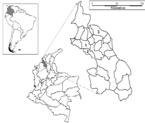
Figura 1. Ubicación geográfica de los municipios del departamento de Sucre, Colombia, en los cuales se realizó la búsqueda activa de garrapatas: 1, Sincelejo (Sabanas del Potrero); 2, Sampués (Escobar Arriba); y 3, Ovejas (El Campín).

La investigación se desarrolló en tres municipios del departamento de Sucre, Sincelejo (Sabanas del Potrero), Ovejas (El Campín) y Sampués (Escobar Arriba). Este departamento se encuentra localizado en la Costa Caribe de Colombia (Fig. 1).