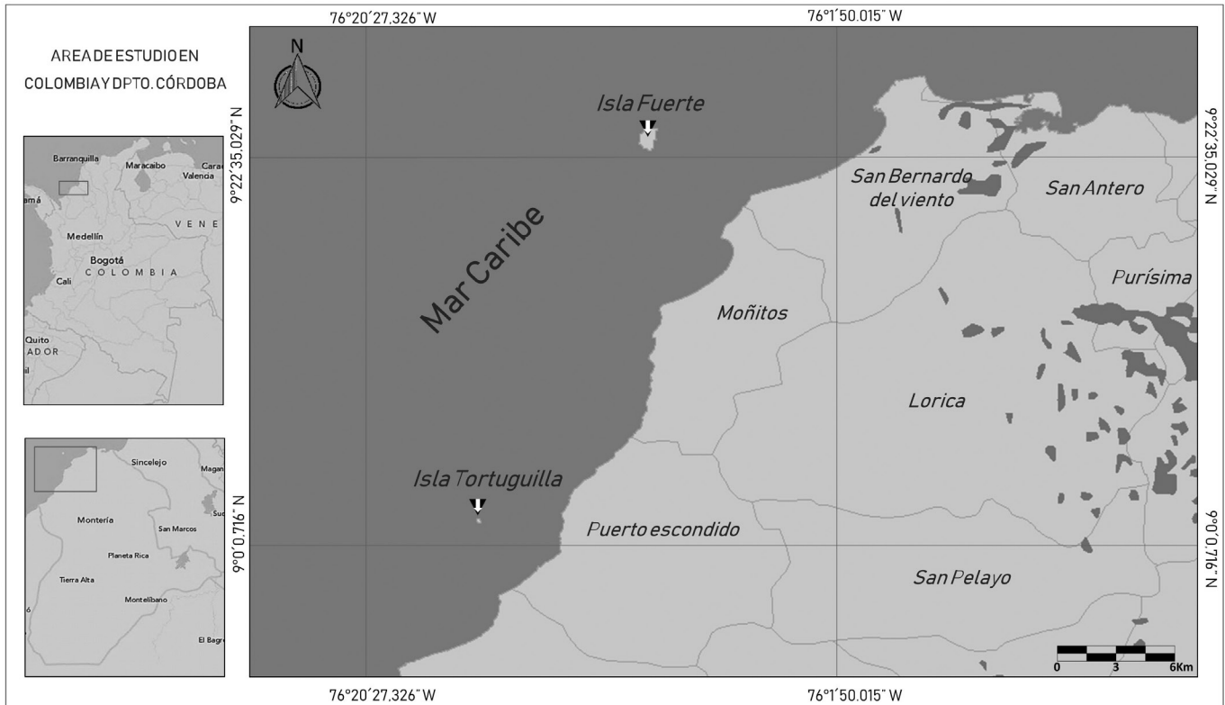
Figura 1. Localización de las Islas continentales frente a la costa del departamento de Córdoba, Caribe Colombiano.