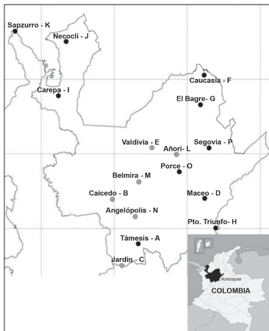
Figura 1. Localización de las diferentes áreas de estudio en el departamento de Antioquia, Colombia. Los puntos oscuros representan todos los sitios con altitudes por debajo de los 1.500 m ( Tb = tierras bajas); y los puntos grises representan los sitios con altitudes por encima de los 1.500 m ( Ta = tierras altas)

helechos arbóreos y lianas, con diámetro a la altura del pecho ( DAP ) \geq 10 cm; a su vez, en el centro de cada parcela de 1 ha se ubicó una subparcela de 40 x 40 m (1.600 m 2 ) donde se censó la vegetación entre 1 \text{ cm} \leq \text{DAP} \leq 10 \text{ cm} , teniendo en cuenta los hábitos de crecimiento antes señalados. Para los cálculos de la densidad de individuos por ha y área basal asociadas con \text{DAP} \leq 10 \text{ cm} , se extrapoló el valor encontrado en la subparcela de 0,16 ha. A cada árbol se le registró información del DAP y a un 40% del total de individuos se le estimó la altura total ( H ). En árboles con alturas > 15 \text{ m} , la altura total se estimó con un hipsómetro digital (Nikon Forestry 550); para árboles con alturas < 15 \text{ m} , se empleó una vara extensible de igual longitud.