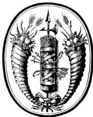
Figura 1. Armas de la República de Colombia, 1821.

cornucopias también concebía el progreso material de la nación como lo definía la economía política moderna. 26