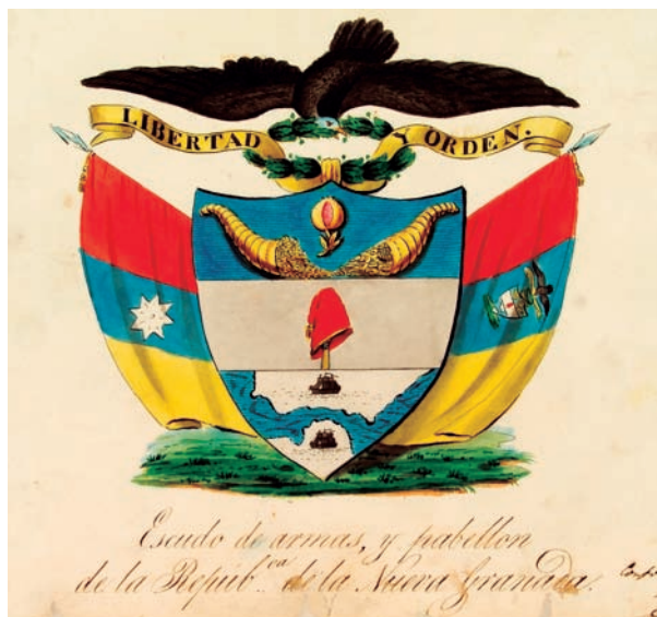
Figura 3. Escudo de armas de la república de la Nueva Granada en 1834.