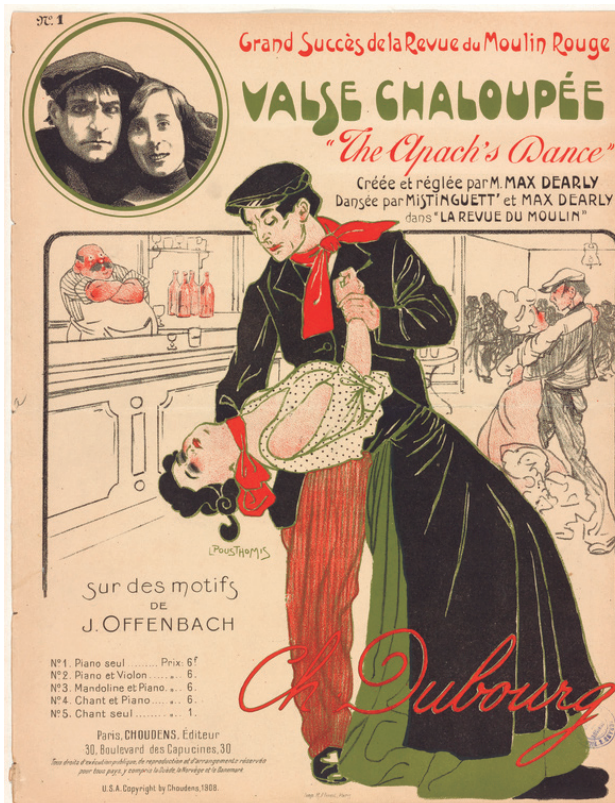
Figura 5. La danza apache.