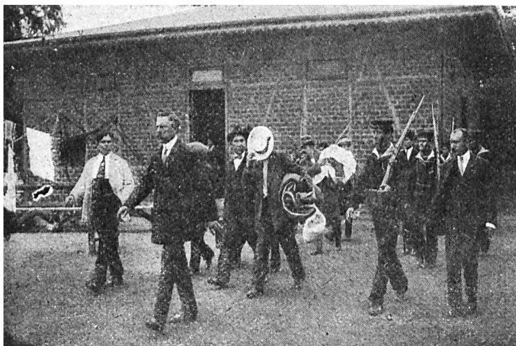
Figura 2. “Deportación de apaches”.

En medio de esta campaña, Sherlock Holmes ofreció a sus lectores un agrio fotorreportaje de los apaches siendo embarcados en el puerto de Buenos Aires. El texto, de inclemente dureza con los expulsados, cuestionaba cualquier “falsa piedad social que, a título de un humanitarismo alambicado, oponga barreras de prejuicios a las justas satisfacciones de la ley coercitiva”. 22 En ese mismo tono, cada fotografía era acompañada por un comentario chacotero cargado de porteñísimo vocabulario lunfardo: “¿Qué tenés vergüenza? ¡El que se tapa la cara descubre malas intenciones!”, “Otro que le tiene tirria al objetivo, ¡pobre inocente!”, glosaba una imagen en la que el deportado se cubría el rostro para no ser captado por la cámara, mientras era escoltado por policías armados. “¡Groseros! ¡Salvajes! ¡Rastacueros! ¡Ni changador le dan a uno para que lleve la lingerie!”, se leía al pie de la foto de un deportado que cargaba sus pertenencias en una bolsa al hombro. Y así se despedía a los apaches a bordo de las lanchas que los llevarían hasta el transatlántico: “En viaje de recreo, ¡dichoso aquel que tiene su casa a flote!”, “¡Adiós, Buenos Aires, que te quedás sin gente! ¡Que seas feliz con tus taparrabos!”.