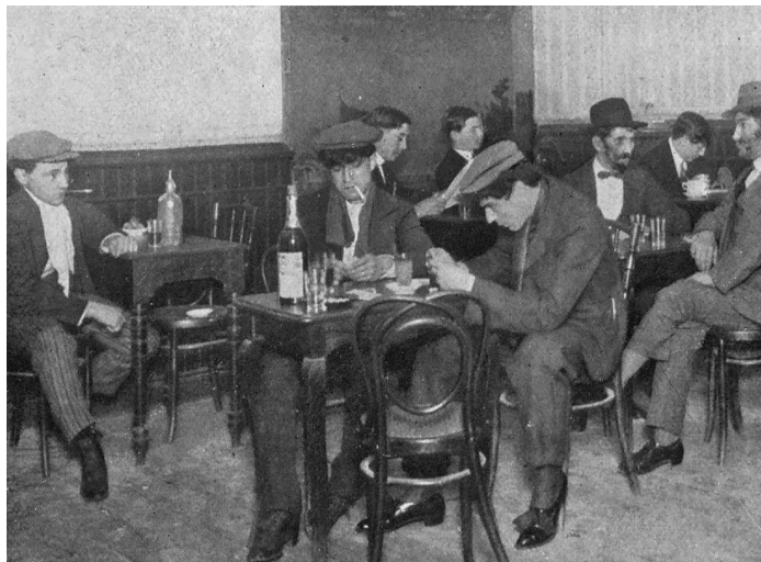
Figura 1. “Buenos Aires tenebroso: los apaches”.