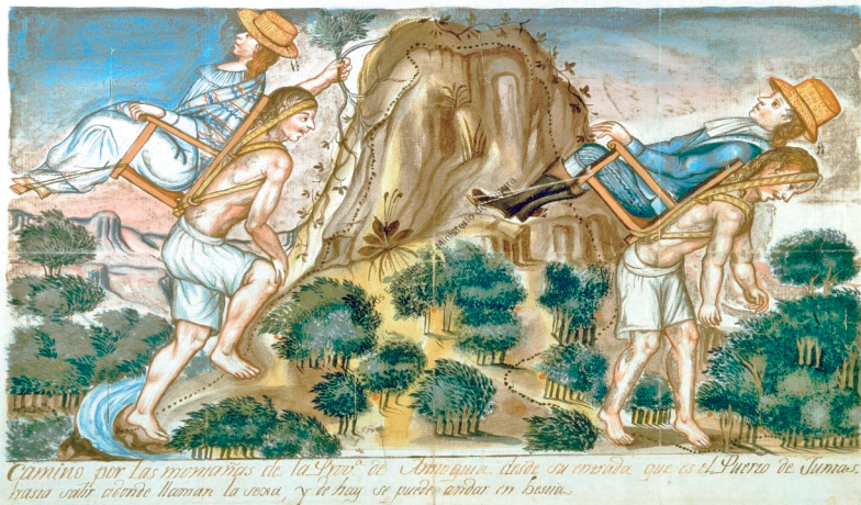
Figura 1. Hombres acémilas, baqueanos de las montañas de Antioquia.

Fuente: “Camino por las montañas de la Provincia de Antioquia, desde su entrada que es del puerto de Juntas hasta salir a donde llaman la Sexa, y de ahí se puede andar en bestia”. Ca. 1800. Archivo General de Indias (AGI), Sevilla, MP-Estampas, 257.