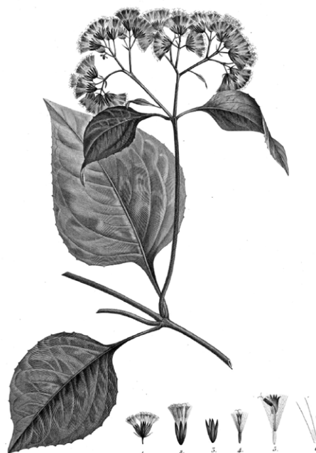
Figura 3. Mikania guaco .

nativo sobre el tema de la quina, fue encontrado por Eduardo Estrella en el Archivo del Real Jardín Botánico de Madrid y transcrito por él mismo en la última parte de su artículo. 55