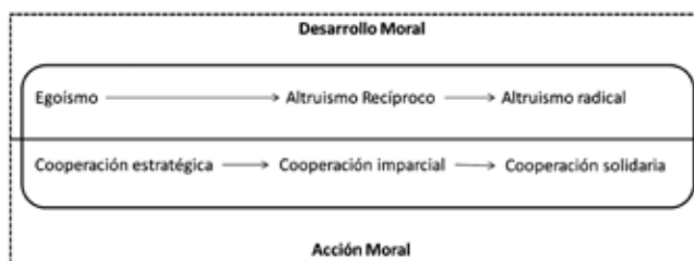
Figura 1. Evolución del desarrollo moral y de la acción moral en las relaciones entre individuos

Esta línea de evolución (véase figura 1), cuando se coordina con las consecuencias de la acción moral del individuo sobre otros individuos o un grupo particular (Villegas, 1995), sugieren el paso de una cooperación estratégica orientada por el beneficio propio, pasando por la cooperación imparcial en la cual se restringe la consideración de diferencias superficiales entre individuos y finalizando en una cooperación solidaria, capaz de admitir principios éticos y de bienestar común.