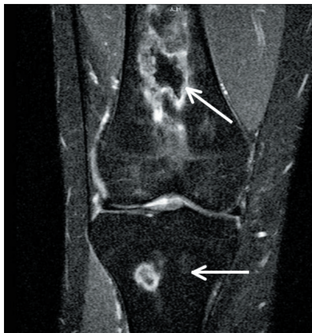
Panel B. Imagen en secuencias de supresión grasa, corte coronal de la rodilla. Las flechas señalan lesiones óseas, de centro isointenso y periferia hiperintensa que corresponden a infartos óseos.

Paciente de 19 años, con diagnóstico de lupus eritematoso sistémico (LES), en tratamiento con corticosteroides, quien consultó por dolor de tres meses de evolución en la rodilla derecha, limitante y sin respuesta a analgésicos, por lo que se realizó resonancia magnética (RM), que mostró lesiones focales óseas, de bordes irregulares, en el aspecto distal de la diáfisis femoral y proximal de la diáfisis tibial; isointensas en T2, en densidad de protones (DP) (Panel A) y en secuencias de supresión grasa (Panel B), con un halo hipointenso en T1 y DP (panel A) e hiperintenso en T2 y en secuencias de supresión grasa (Panel B), indicando infartos óseos.