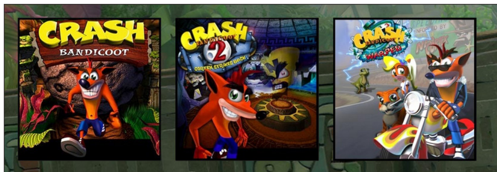
Figura 2. Carátulas de videojuegos de la saga Crash Bandicoot

Si Mario era la franquicia estrella de Nintendo y Sonic lo era de Sega, la mascota corporativa de Sony podría identificarse en Crash Bandicoot (figura 2), videojuego protagonizado por Crash, el personaje de la franquicia de juegos que lleva el mismo nombre, el cual fue creado en 1996 por la compañía estadounidense Naughty Dog (Martínez, 2016) en exclusiva (inicialmente) para la consola PlayStation. Crash es el protagonista de un juego de plataformas y, al igual que Sonic, es un animal antropomórfico, si bien se diferencia del erizo azul en que presenta una personalidad más de estilo grunge 7 , más ingenua y despiadada que la mascota de Sega de tal forma que el humor logra, en esta saga de juegos, una mayor presencia que en las franquicias de Mario y Sonic.