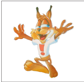
Figura 5. Bubsy, el personaje diseñado por Accolade

Una característica básica de este personaje es el uso de constantes muletillas para lograr el tan ansiado aplauso de los amantes de los videojuegos (Griefas, 2010, p. 168), estrategia que ya, anteriormente, había aplicado con enorme éxito Bugs Bunny (el personaje de dibujos animados de los años 40) y su célebre frase "Eh... What's up, doc? ".