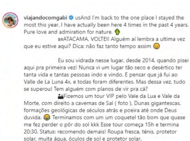
Figura 2: Viajando com Gabi - Viagem à Bolívia.