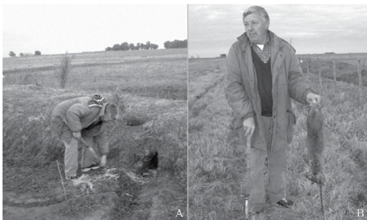
Figura 1A. Revisado de la trampa y muerte del animal Figura 1B. Cazador con la presa y el garrote

El nutriero contactado localizó un número de cuevas en las proximidades de la Ruta Nacional N° 3 (kilómetro 180), observando también otros indicadores como caminos y materia fecal, que indicaban la actividad de coipos. Por la noche tendió dos trampas-cepo en la boca de las cuevas. A la mañana siguiente se halló un coipo juvenil atrapado, de aproximadamente 2 kg. El animal aún estaba vivo, se le dio muerte por medio de un golpe en la cabeza con un garrote (en este caso, un palo de hockey que el cazador habitualmente empleaba) (ver las figuras 1A y 1B).