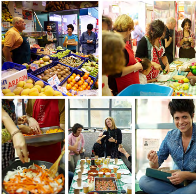
Figura 2. Imágenes de una de las comidas de Cocinar Madrid en el mercado de Argüelles