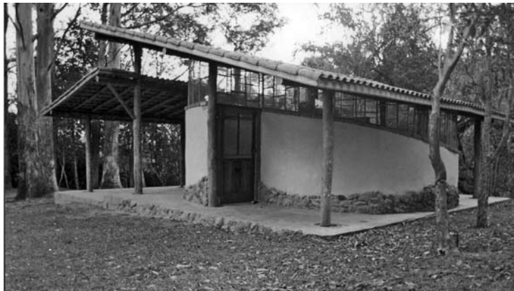
Figura 24: Sede de hacienda en estructura de madera y bahareque, Silveiras, São Paulo.