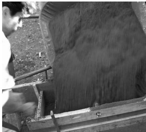
Figura 6: Poniendo la tierra en el molde.