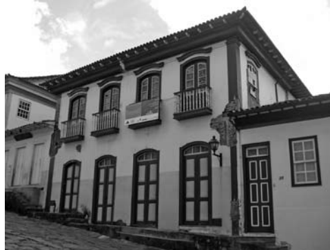
Figura 14: Casa del cielo raso pintado, Diamantina, Minas Gerais.