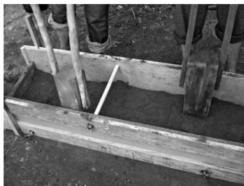
Figura 7: Comprimiendo el suelo.