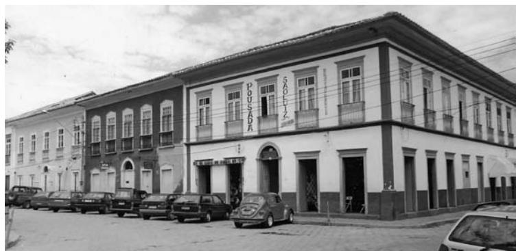
Figura 15: São Luiz do Paraitinga, São Paulo.