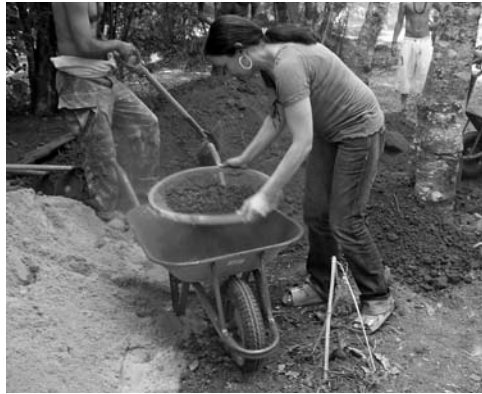
Figura 2: Pisando el barro.