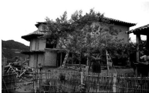
Figura 21: Vivienda urbana de adobe y bahareque, Tiradentes, Minas Gerais.