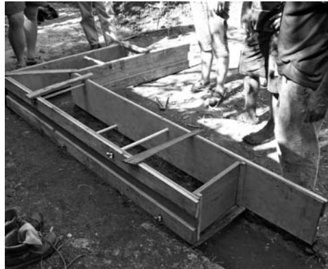
Figura 5: Tapial tradicional de madera.

Para fines de construcción, las propiedades principales son: textura, plasticidad, cohesión, naturaleza mineral y composición química de las partículas finas que constituyen la unión natural.