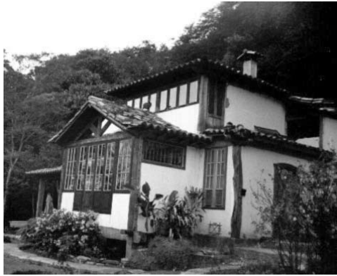
Figura 20: Vivienda rural de adobe y material de demolición, Tiradentes, Minas Gerais.

Arquitectura de la necesidad. Son las construcciones espontáneas, normalmente ubicadas en la zona rural y en las periferias de las grandes ciudades. Existen regiones en Brasil que mantienen la cultura de construcción con tierra cruda; en su mayoría son extremadamente pobres. Ejemplo de eso es el Vale do Jequitinhonha, ubicado en el estado de Minas Gerais, considerado como una de las áreas más pobres del país, donde las técnicas utilizadas son el adobe y el bahareque.