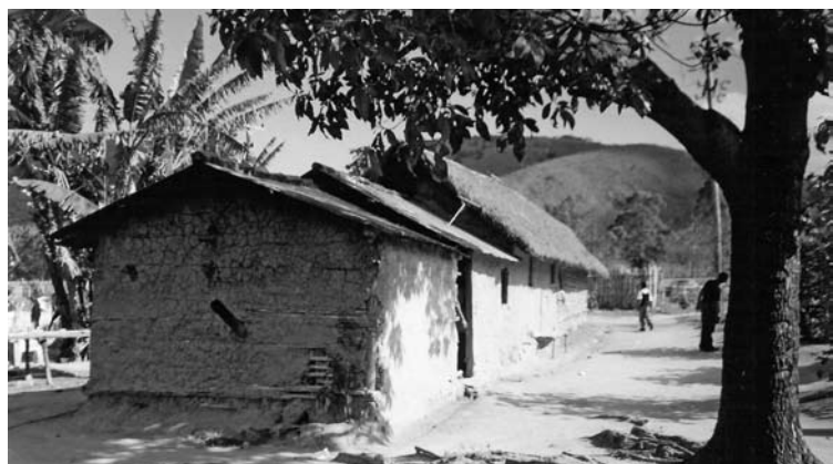
Figura 16: Quilombo São José, Valença, Río de Janeiro, construcción en bahareque.

mínimo, generando un gran número de construcciones inacabadas y sin seguridad. A esa paradoja la denominamos paradigma y tiene urgentemente que ser substituido por un nuevo.