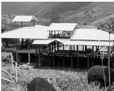
Figura 23: Vivienda rural de bloque de suelo cal, Visconde de Mauá, Resende, Río de Janeiro.

La depreciación del uso de esos recursos es muy intensa; cuando las familias migran a las zonas urbanas, la mayoría se rehúsa a construir sus casas con esas técnicas. La pérdida de la referencia cultural, a través del abandono del manejo, que es un conocimiento empírico, refuerza el prejuicio todavía existente, en detrimento del uso de materiales convencionales que, además de ser