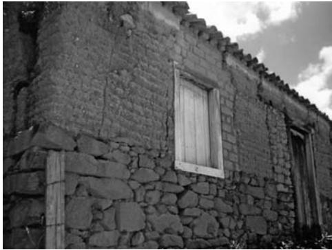
Figura 18: Construcción rural en bahareque, Vizconde de Mauá, Resende, Rio de Janeiro.