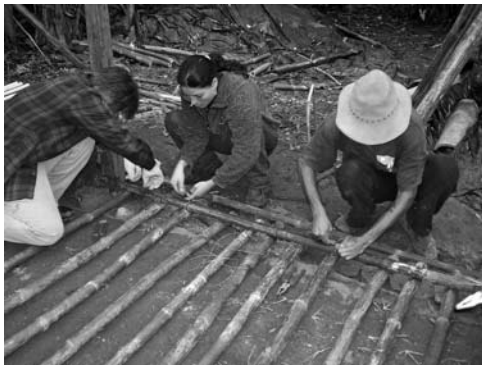
Figura 12: Pared lista.