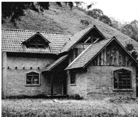
Figura 22: Vivienda rural con estructura de eucalipto y bahareque, Monteiro Lobato, São Paulo.