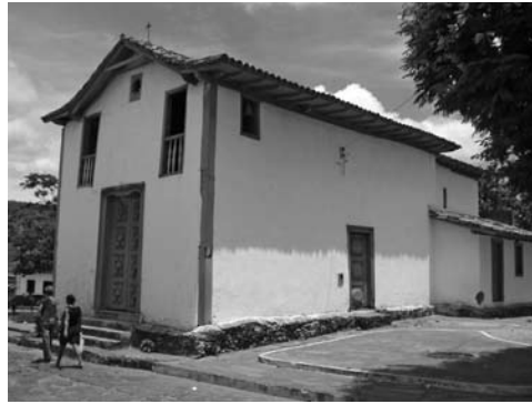
Figura 13: Iglesia São Gonzalo, Minas Novas, Minas Gerais.

Con la aceleración de la industrialización en el inicio del siglo pasado, fueron introducidos procesos y productos que perfeccionaron la producción de bienes materiales. Así, el uso de determinados recursos en la construcción de viviendas, como las técnicas artesanales y no convencionales, no ha sido bien recibido por constructores, organismos financieros y, consecuentemente, pobladores. El acceso a determinados productos, en su mayoría, está limitado a los segmentos con mayor poder adquisitivo, quedando a los de menor renta el mal uso de algunos materiales, siempre en la búsqueda de hacer el máximo con el