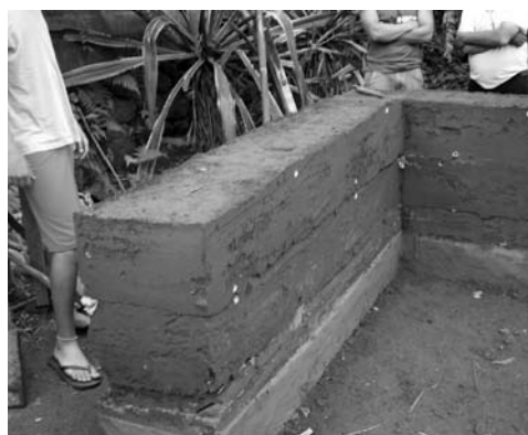
Figura 8: Muro de tapia.

Tales propiedades son cuantificadas por procedimientos de prueba específicos y precisos que se realizan en laboratorio: tamiz húmedo, sedimentación, límites de Atterberg, azul de metileno, rayos x, análisis químicos, etc.