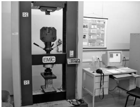
Figura 6: Estudio sobre empleo de biomasa de macrófitas acuáticas en la producción de adobes – Ensayos de adobe. Universidade Estadual Paulista, Bauru.