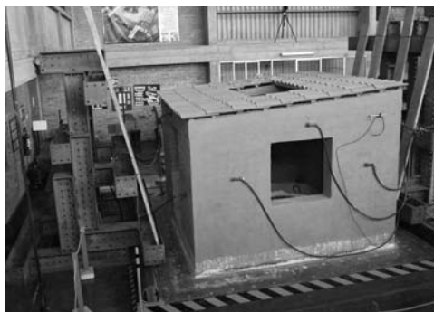
Figura 8: Estudio del efecto de sismos en edificaciones, PUC del Perú, 2005.