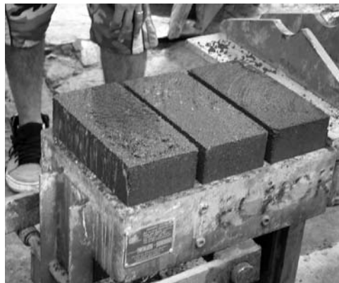
Figuras 10 y 11: Máquina de BTC, modelo adaptado de la CINVA RAM. Autor: Célia Neves.

Temática Habiterra con el objetivo de sistematizar el uso de la tierra en viviendas de interés social a través de la recopilación de la tecnología ya existente, catalogación de las técnicas constructivas, normalización, difusión de los conocimientos y ejecución de proyectos piloto de construcción en tierra. La red temática Habiterra contribuyó significativamente en el proceso de innovación tecnológica, principalmente en la identificación de especialistas y de técnicas utilizadas en los países iberoamericanos, en el intercambio de estas informaciones a través de sus representantes y en la divulgación de la tecnología. En octubre de 1993, durante la III Reunión Plenaria realizada en La Habana, Cuba, fue inaugurada la ExpoHabiterra, una exposición itinerante que muestra obras en tierra en Iberoamérica, presentada también en la publicación “Habiterra. Exposición iberoamericana de construcciones de tierra” (Habiterra, 1995); además publicó “Arquitecturas de Tierra en Iberoamérica” (Habiterra, 1994) que presenta técnicas constructivas consolidadas y en desarrollo, direcciones de instituciones, bibliografía y glosario