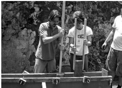
Figura 7: Seminario Taller en Ouro Preto, Brasil, 2006.