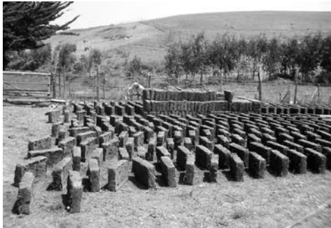
Figura 5: Fabricación de adobe por un campesino en Chile, 2006.