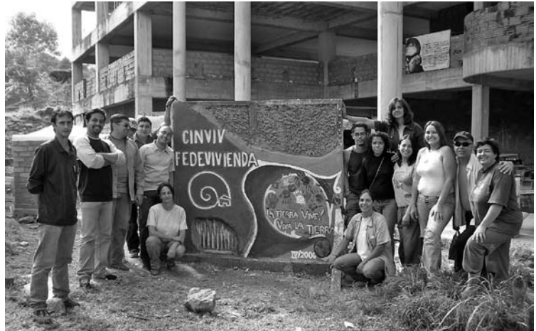
Figura 9: Curso-taller en Venezuela, 2006. Autor: Lucía Garzón.

Por eso, se verifica hoy en Iberoamérica un número expresivo de profesionales capacitados en restauración de edificaciones y conservación