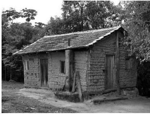
Figura 4: Cobijo de bahareque en Brasil.

En Brasil, los estudios de construcción con tierra realizados en las décadas de 1970 y 1980 fueron dirigidos especialmente al uso del suelo estabilizado. Con el apoyo de los institutos de investigaciones, se dispone de un volumen significativo de conocimientos sobre suelo-cemento, suelo-cal y suelo-“borra de carbureto” –residuo industrial resultante de la producción del acetileno–, junto con trece normas técnicas publicadas relativas al uso