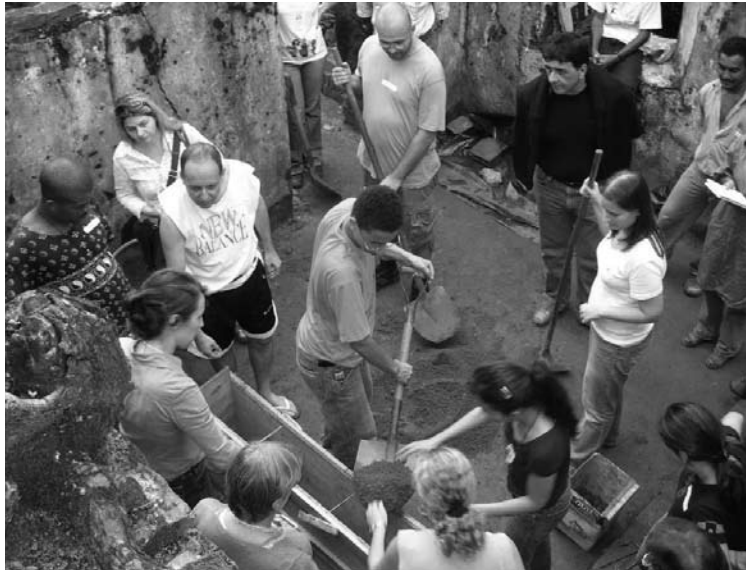
Figura 12: Terra Brasil 2006, Brasil, 2006. Autor: Anita Frison.

sobre construcción en tierra, y “Recomendaciones para la Elaboración de Normas Técnicas de Edificaciones de Adobe, Tapial, Ladrillos y Bloques de Suelo-cemento” (Habiterra, 1993).