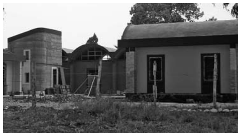
Figura 4: Vista interior del sector de aula-taller del CRIATIC-FAU UNT. Muros de mampostería de BTC y tapial, cubierta de bóvedas de cañón corrido con BTC livianos.