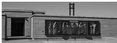
Figura 6: Vista del frente de la Capilla de la Gratitude, Mendoza, Argentina.

Se asocia frecuentemente la arquitectura de tierra con la arquitectura bioclimática. Si bien los puntos de contacto son muchos, que un edificio esté hecho en tierra no implica automáticamente que es bioclimático, así como también si una parte ínfima de un edificio bioclimático está construida con tierra no significa una arquitectura de tierra.