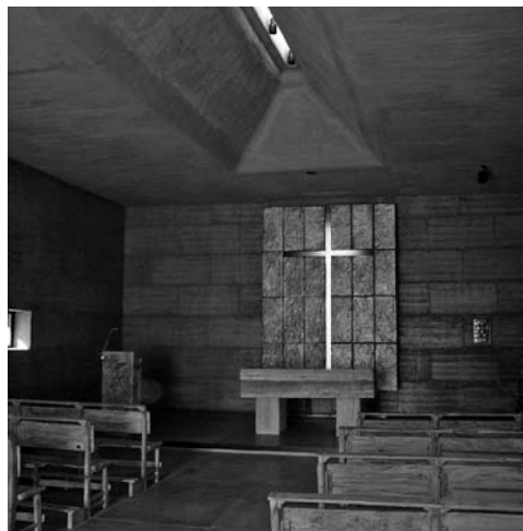
Figura 7: Vista interior de los muros de tapial visto, altar de piedra y cruz calada en placas de plomo, en la Capilla de la Gratitude, Mendoza, Argentina.