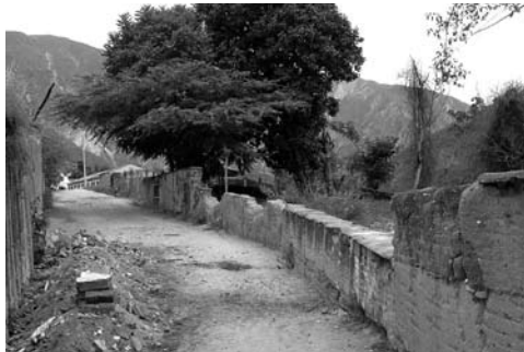
Figura 15: Estado de los muros de acceso a Cepitá.