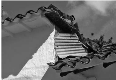
Figura 6: Mantenimiento incorrecto por pérdida de cultura constructiva en el Páramo, Santander.

La intervención fue adelantada por la Gobernación de Santander bajo la tutela del Ministerio de Cultura. En ella, la Fundación Tierra Viva tuvo a cargo la interventoría y la asesoría especializada al contratista para que adelantara las acciones de la manera más respetuosa hacia la edificación procurando salvar el máximo posible. Las tareas adelantadas fueron de remoción de escombros, desmonte controlado de muros en estado de inminente colapso, primeros auxilios y adecuación de espacios para uso transitorio. La intervención estuvo sustentada en el conocimiento del material tierra, de los sistemas constructivos utilizados pa-