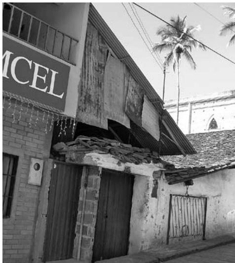
Figura 8: Afectación en Valle de San José, Santander, por pérdida de cultura constructiva.

ra levantar la edificación y de su comportamiento estructural.