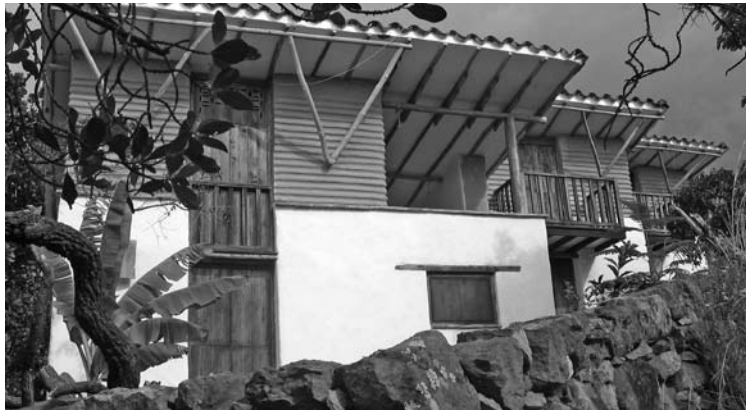
Figura 5: Restaurante Universidad Adventista. Construido en 2004-2005. Medellín.