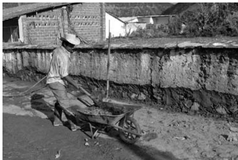
Figura 16: Durante el taller de formación para la recuperación de los muros de acceso.