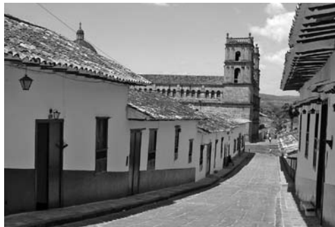
Figura 2: Nueva intervención en el Centro Histórico de Barichara.