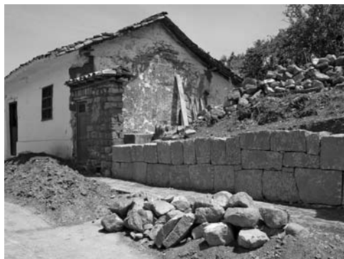
Figura página anterior: Cadrilla de tapieros en una obra contemporánea ubicada en Barichara.