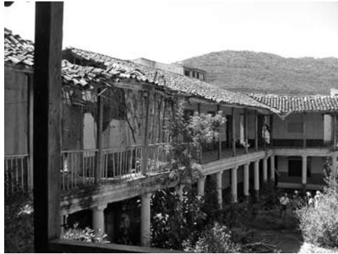
Figura 10: Colapso del sector de la Casona del Colegio Guanentá sobre la carrera 10 en San Gil.