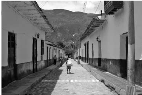
Figura 14: Calle de Cepitá.

En el año 2005 el equipo de la Fundación Tierra Viva dirige su acción hacia la concepción y desarrollo de proyectos de carácter institucional –preferiblemente estatal– en lugares diferentes a Barichara, cuya principal característica es la constatación del impacto social de la tierra como