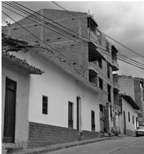
Figura 7: Intervención agresiva en el centro Histórico de San Gil, Santander.