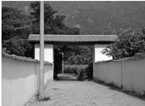
Figura 17: Portal de acceso construido con la mano de obra formada y detalle de muros recuperados.

material de construcción. En este escenario se acuña el concepto de “Vivienda de Interés Cultural” como aquella vivienda cuyos componentes fundamentales de concepción son la cultura y la tradición sustentadas en la viabilidad técnica y económica. Una vivienda que reivindica el oficio local, la apropiación sensata de los recursos del entorno, estimula la participación comunitaria elevando el autoestima y genera identidad cultural. De esta manera se busca también el objetivo de sentar antecedentes contundentes para propiciar el marco legal de la arquitectura en tierra.