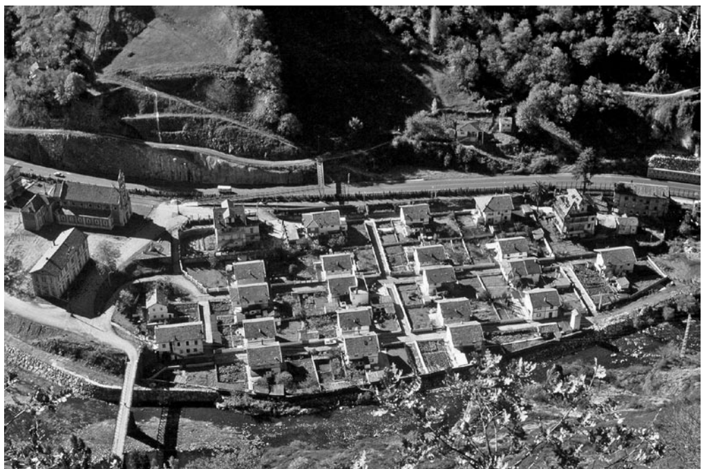
Figura 6: Vista de Bustiello en Asturias (España), modelo de poblado de mineros, con tipología de casa jardín a semejanza de Mulhouse, construido a instancia del Marqués de Comillas en el periodo de 1890 a 1920, hoy rehabilitado y punto de interés cultural y turístico, 2002.