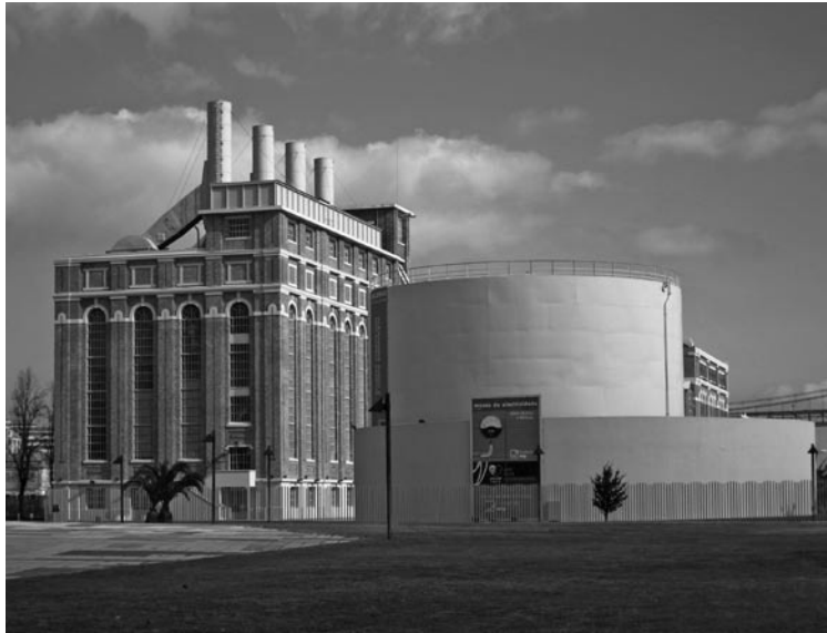
Figura 2: Central Tejo en Lisboa (Portugal), complejo armonioso resultante de sucesivas ampliaciones de esta "central-fábrica" en la primera mitad del siglo xx. Hoy alberga el Museo Nacional de la Electricidad, 2008.

Contrario al concepto de museo al aire libre puesto en marcha en los países nórdicos, como el citado de Skansen de Estocolmo, los ecomuseos no requieren trasladar casas y construcciones que se quieren mostrar y exhibir, sino que el concepto novedoso es dejar todo en su sitio, en el propio paisaje natural; por tanto, se plantea que los visitantes se trasladen por determinados itinerarios a los diversos espacios industriales. De hecho, en Suecia tomaron y desarrollaron esta idea del ecomuseo para construir el proyecto museístico de Bergslagen a principios de los años ochenta (Bergdahl, 1998, pp. 148-154).