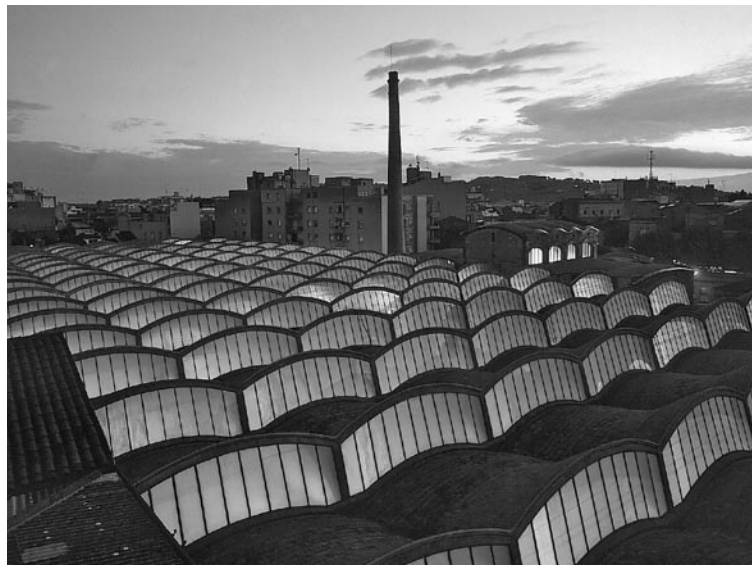
Figura 5: Museo de la Ciencia y Técnica de Cataluña, sito en Tarrasa, cabecera del sistema de gestión cultural en patrimonio industrial, aplicado en museos de esta comunidad española, 2004.