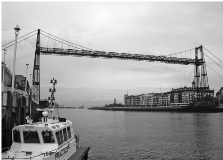
Figura 7: Puente colgante de Portugalete en el País Vasco, declarado patrimonio mundial en el año 2006.

El gobierno de la comunidad autónoma de Asturias tiene desde 2003 una Consejería de Cultura y Turismo que permite afrontar programas más eficaces y eficientes desde una perspectiva político-administrativa. No todas las regiones europeas disponen de esa situación. El caso de la región de Gales, en el Reino Unido, entre otras, es similar en ese sentido. Disponer de una ley de Turismo, de una ley del Suelo y Ordenación del Territorio, de unas leyes proteccionistas del Paisaje Protegido de las Cuencas Mineras o de la ley de Patrimonio Cultural, de marzo de 2001, en cuyo artículo 76 y siguientes se explicita el patrimonio industrial como nuevo bien cultural y se definen sus características y prescripciones al respecto, supone un paso adelante en la adopción de políticas integrales, pero los muchos recursos puestos en marcha no suponen tener un producto turístico, ya que esto llevaría asociados servicios e industrias culturales que posibilitaran poner los llamados paquetes turísticos en el mercado, cuestión todavía en ciernes.