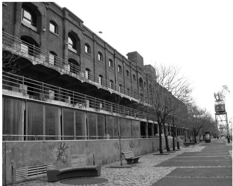
Figura 3: Paisaje urbano-portuario de Puerto Madero en Buenos Aires tras la intervención urbanística y readaptación a nuevos usos de edificios industriales y grúas, 2007.

Los museos, la arquitectura industrial, la historia técnica con su didáctica de cómo se hacían “las cosas”, las viviendas obreras y edificios sociales reutilizados, las tradiciones y costumbres, el conjunto de elementos materiales e inmateriales por sus contenidos y localizaciones supera el concepto de edificio aislado en numerosas ocasiones. Se han creado auténticos paisajes industriales que son paisajes culturales.