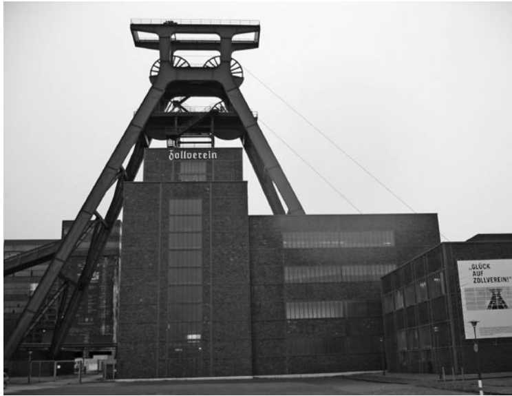
Figura 8: El Pozo Zollverein, en la cuenca del Ruhr alemana, ha sido reconvertido en un contenedor polifacético de museos, con centro de itinerarios de industria y cultura por el territorio, 2006.

nio urbano a espacios industriales y rurales con numerosos recursos patrimoniales mediante políticas de nuevas infraestructuras y de ordenación del territorio en una comunidad donde en un radio de veinticinco kilómetros viven más de 800 mil personas.