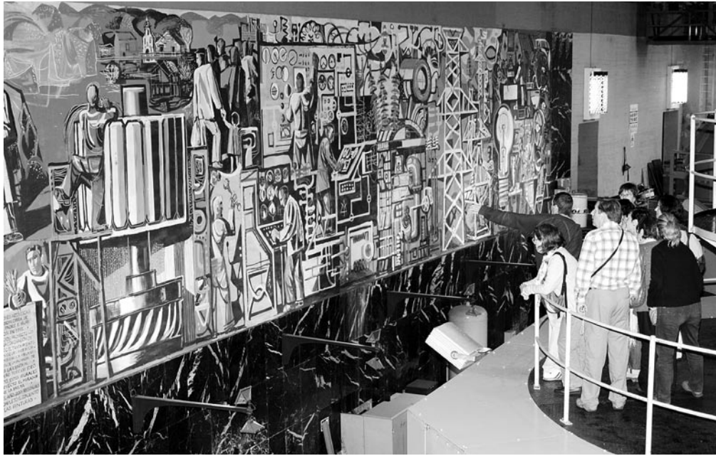
Figura 4: Central Hidroeléctrica de Salime en Asturias (España), incluida en el Plan Nacional de Patrimonio Industrial, proyectada por el arquitecto Joaquín Vaquero Palacios en los años cincuenta del pasado siglo, exponente notable de ingeniería, arquitectura y elementos artísticos; sus murales explican el proceso de construcción de esta ingente obra dentro de un paisaje de gran belleza, 2005.