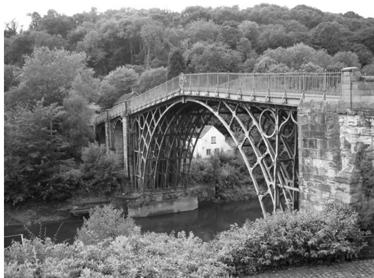
Figura 9: Ironbridge en el valle del río Severn en los Midlands ingleses, cuna de la civilización industrial, hoy convertido en un reclamo turístico y cultural con un circuito de 14 kilómetros lleno de antiguas fundiciones, instalaciones y patrimonio residencial-histórico-industrial, 2007.

9 Route IndustrieKultur. Das Ruhrgebiet, Kommunalverband Ruhrgebiet, Entdeckerpass, 2004. Véase también Ebert (2003, pp. 73-78).