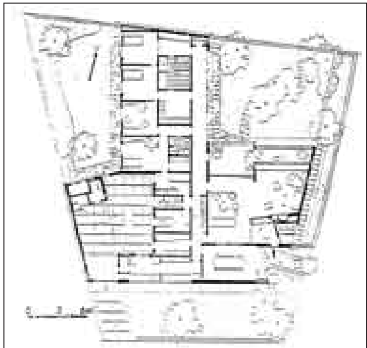
Figura 9: Rino Levi. Residência do Arquiteto, São Paulo, 1944. La racionalidad del trazo ortogonal en diálogo con las contingencias del sitio. Fuente: Archivo Rino Levi, São Paulo.

11 En declaración de 1928, Marcelo Piacentini promovía la existencia de dos arquitecturas: una vestida con traje íntimo y otra con traje de gala (citado en Schumacher, 1991, p. 30).