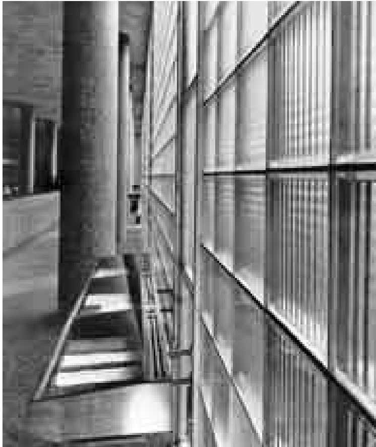
Figura 7: Rino Levi. Banco Paulista do Comércio, São Paulo, 1947. Estructura independiente del plano de fachada.