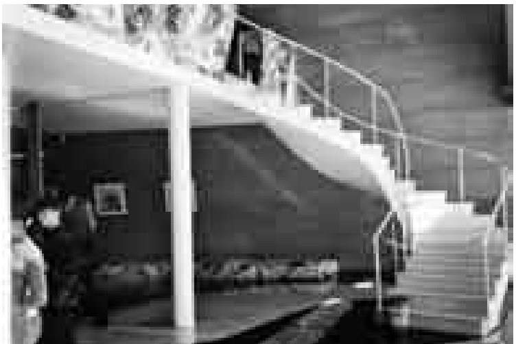
Figura 6: Oscar Niemeyer. Capela de São Francisco, Pampulha, Belo Horizonte, 1940. Escalera de acceso al coro.

Brasil. Era como si, a través de la correcta solución de los problemas técnicos, con la primacía, sobre todo, de la calidad de la construcción, fuera posible si no evitar, al menos minimizar las contradicciones sociales. Levi dedica gran esfuerzo a la renovación de la arquitectura confiando en las virtudes pedagógicas del ambiente construido que consideraba como un instrumento de transformación individual y social. Dirá el arquitecto más tarde: