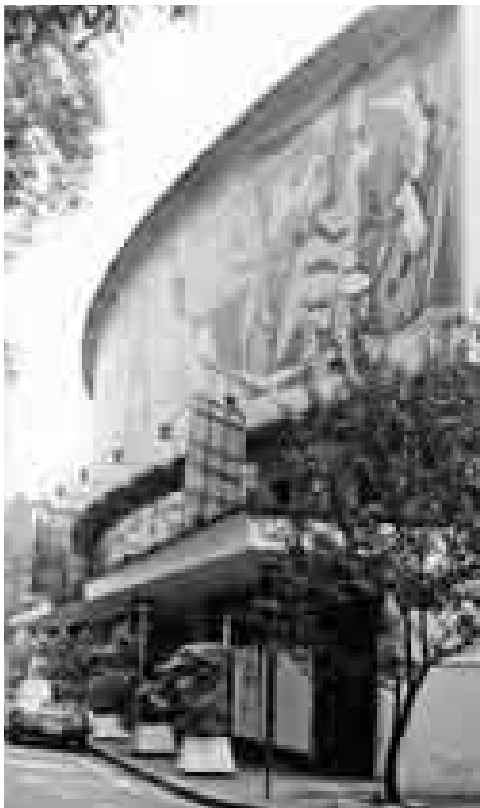
Figura 11: Rino Levi. Teatro de Cultura Artística, São Paulo, 1942. Pínel de mosaicos de vidrio con alegorías teatrales de autoría de Emiliano Di Cavalcanti.

las actitudes más aconsejables y hacer frente a las contradicciones de la metrópoli moderna constituía, así, un desafío. La ciudad era todavía un artefacto cultural salvable y, obviamente, debía ser urbanística y arquitectónicamente modernizada de manera que permitiera el progreso industrial y técnico.