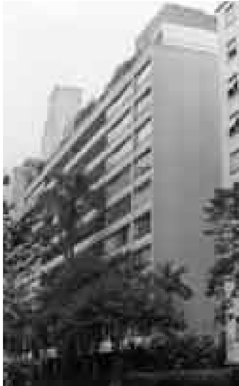
Figura 14: Rino Levi. Maternidade Universitária, São Paulo, 1941. Con un “giro” la composición acompaña el contorno del solar.