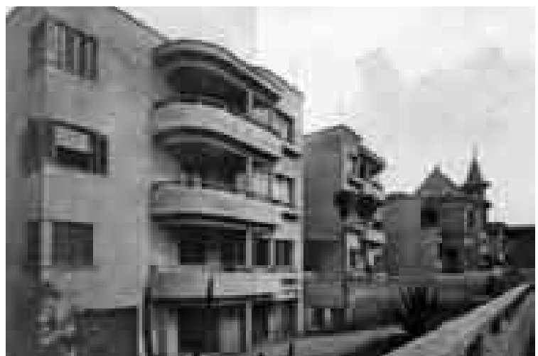
Figura 2: Edificio Nicolau Shiesser, São Paulo, 1934.