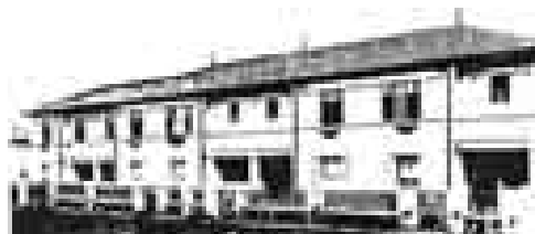
Figura 1: Rino Levi. Viviendas del Conjunto Melhen Zacharias y del Conjunto Luiz Manfro, São Paulo, 1928.