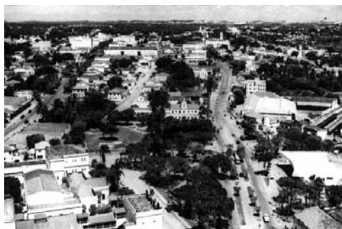
Figura 4: La Ribeira en los años 1960, y en la parte baja de la foto, la Plaza después de su división.

Para Robba y Macedo (2002), el crecimiento urbano exigió nuevas intervenciones, como la construcción y redimensionamiento de la red vehicular, en función de los automóviles y del transporte colectivo. Esa tendencia del urbanismo moderno brasileño concordaba con el movimiento automotor iniciado en Brasil durante el gobierno de Juscelino Kubitschek, en la década de 1950. Las inversiones en transporte automotor condujeron a los centros urbanos, diariamente, un gran número de vehículos colectivos y particulares. En Natal, los ómnibus procedentes del interior paraban en diversos lugares de la ciudad, causando una serie de conflictos urbanos que impulsaron la construcción de la Terminal de Ómnibus. Según Itamar de Souza, "el intendente Djalma Maranhão (1960-1964) lanzó un debate en la prensa con el objetivo de obtener sugerencias sobre el lugar donde debería construirse la Terminal de Natal" (Souza, 2001, p. 211).