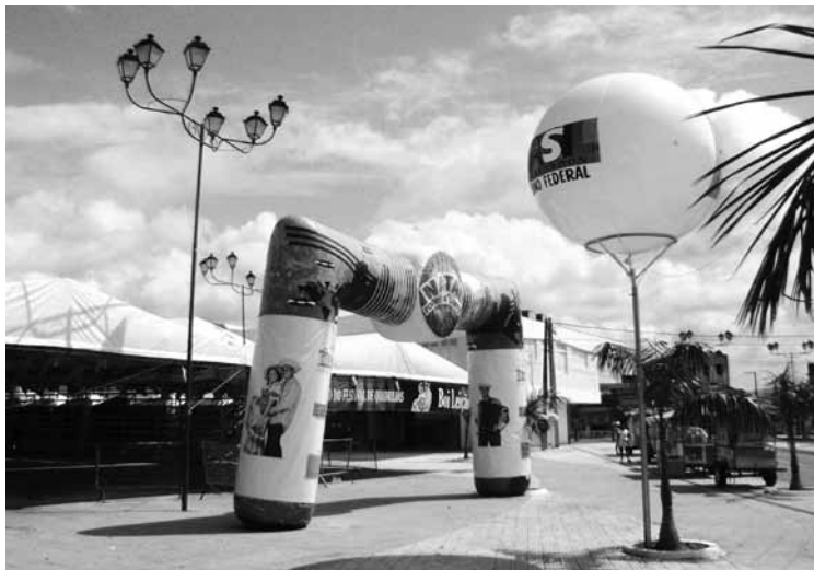
Figura 9: Ejemplo del uso actual de la Plaza.

atraer a la población, pero tales acontecimientos se dan sin la preocupación eficaz con el mantenimiento del jardín y sin el respeto por el valor simbólico de ese lugar.