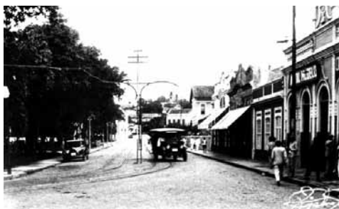
Figura 3: El entorno de la Plaza en las primeras décadas del siglo xx.

En Ribeira existió –porque hoy sólo encontramos una grosera imitación– el más bello y encantador jardín de la Ciudad, una verdadera obra prima de arte y buen gusto. Natal jamás tendrá otro igual. Jardín que alegraba la vista y el alma de los habitantes de la ciudad. Era un enorme edén que tomaba toda la Plaza Augusto Severo en forma circular, muchos árboles, canteros floridos y bien tratados. El jardín era cortado por alamedas con piso de piedritas, varios canales y puentes que con marea alta deslumbraban. En medio de los canales había islas con sapos artificiales. Recreo para nosotros y más aún para los pájaros, que eran numerosos, ya sea cantores volando entre los árboles, ya sea saltarines simpáticos