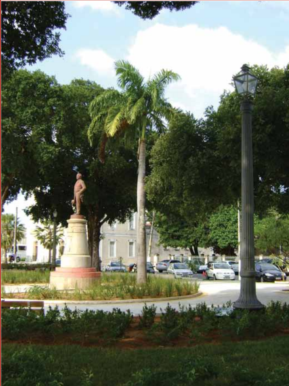
Estatua de Augusto Severo en la actualidad.