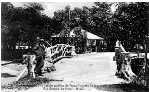
Figura 2: El puente antiguo, a medios del siglo xx.

la autora, tras la contratación del arquitecto, los servicios comenzaron inmediatamente: