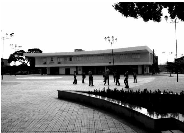
Figura 6: El gran piso en el centro de la Plaza Seca.

Frente a ese cuadro, puede considerarse posible la adecuación del proyecto al momento actual del paisajismo brasileño, inclusive en lo que se refiere a la negación modernista de las referencias históricas. Para Robba y Macedo (2002), otra forma de utilización del espacio público común en las plazas contemporáneas contempla la circulación de peatones. Según el autor, la necesidad de espacio para absorber la enorme cantidad de personas en tránsito en la gran ciudad, sugiere la elaboración de proyectos