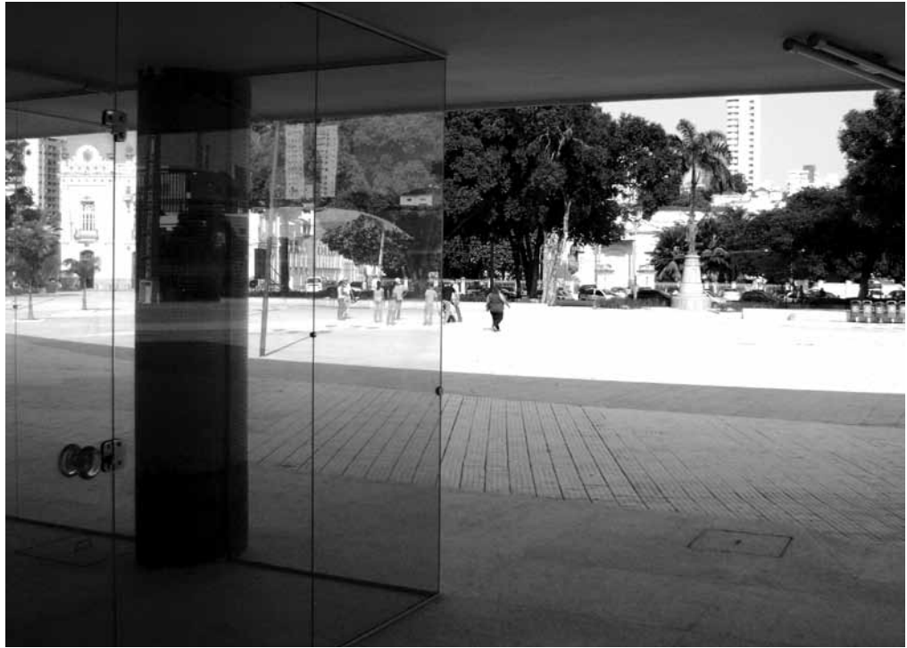
Figura 8: Aspecto del piso térreo del Museo de Cultura Popular, vieja Terminal de Ómnibus.

prensa con nuevas denominaciones como Largo del Teatro o Largo Dom Bosco, en una tentativa clara de borrar el pasado.