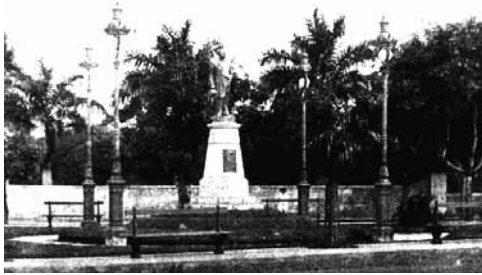
Figura 1: La estatua de Augusto Severo, a principios del siglo xx.

encantada vio el cigarro plateado de 246 metros, que transportaba 50 pasajeros además de la tripulación, dirigirse hacia Ribeira. Allí, sobre la estatua de Augusto Severo, lanzó una corona de flores y siguió viaje hacia Río de Janeiro. (Lima, 1999, p. 147)