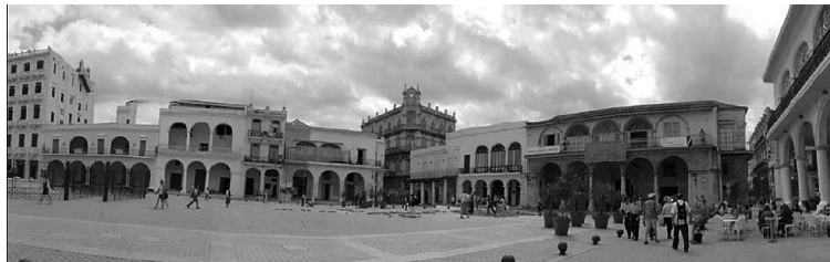
Figura 2: Vista de edificios representativos de diferentes estilos y técnicas constructivas en la Plaza Vieja del Centro Histórico.

Como aplicación práctica, relacionada con esos antecedentes, se puede mencionar el rescate de la edificación ubicada en Paula 201-203 e/ Habana y Compostela, donde el entresijo existente de perfiles metálicos y losas de hormigón se rehabilitó adicionándose una losa de