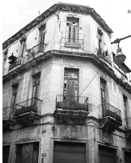
Figura 3: Edificio del sistema constructivo de vigas metálicas y losas de hormigón con alto grado de deterioro estructural.