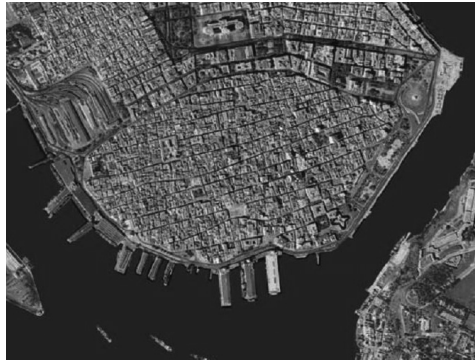
Figura 1: Límites del centro histórico La Habana Vieja dentro de la Ciudad de La Habana.

En Cuba existen grandes posibilidades del uso de los conceptos de la construcción compuesta en las obras de rehabilitación de edificaciones. Esto permitiría reutilizar elementos que han perdido parte de su capacidad resistente, vinculándolos con nuevos materiales, sin necesidad de