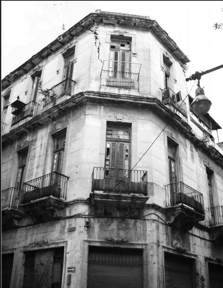
Edificio con deterioro en su estructura horizontal.