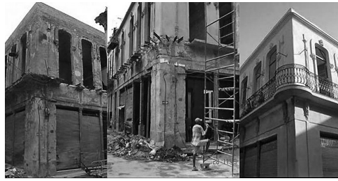
Figura 4: Secuencia de rehabilitación de la edificación ubicada en la calle Paula entre Habana y Compostela. Habana Vieja.

hormigón aligerada con elementos de poliestireno expandido.