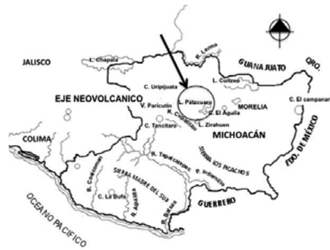
Figura 2: Lugares como la cuenca del lago de Pátzcuaro, en Michoacán, México, son un ejemplo donde el paisaje y el espacio construido son resultado de una herencia transmitida de forma conceptual, gramatical y ontológica.

Así, tanto los sistemas de representaciones, de reglas sociales o de esquemas cognitivos, son vistos aquí con el término 'compromiso ontológico'. Este 'compromiso ontológico' consiste en estructuras de sentido y funciona mediante la aplicación de reglas o sistemas de ellas. Los sistemas de reglas gramaticales y los sistemas