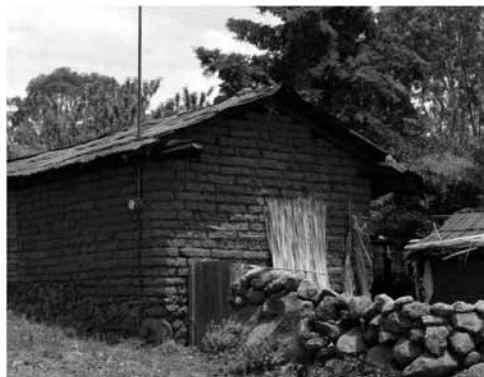
Figura 3: Ubicación geográfica y vivienda vernácula de la cuenca lacustre de Pátzcuaro

Si este autor reconoce que la arquitectura no solo tiene un propósito instrumental, sino una función psicológica (ibíd., p. 16), y plantea como una línea de trabajo el investigar "cómo percibimos realmente" el mundo circundante,