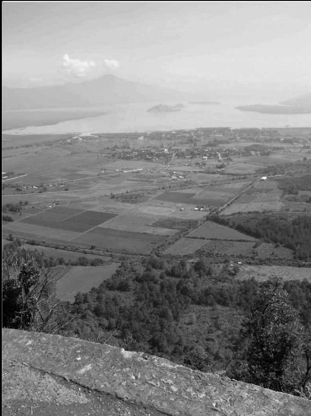
Cuenca Lacustre de Pátzcuaro en el Estado de Michoacán.