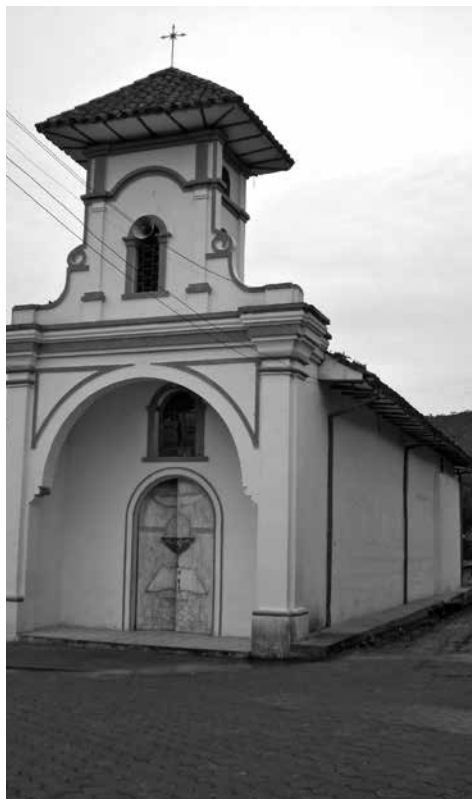
Figura 8: Capilla doctrinera de Tesqual. Fotografía: William Pasuy, 2008

cultural con valor simbólico y mítico-religioso que fundamenta la vida social, política y económica, integrando pisos térmicos, asentamientos humanos y religiosidad, generando una geografía de lo sagrado y evidenciando la dualidad del pensamiento andino como opuesto complementario. Jongovito es muestra de dicha integración a través de la interacción entre lo natural y lo cultural como fenómeno de psicología colectiva.