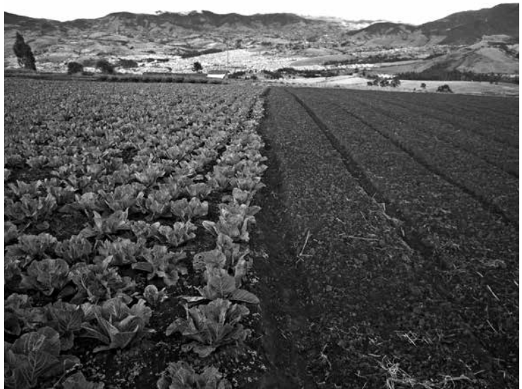
Figura 7: Cultivos en la Pacha Mama en el Valle de Atriz.

La tradición andina, por origen y tiempo, es primaria por cosmovisión, fruto de una organización social prehispánica, dual y complementaria en un continuo proceso de ir y venir, de entrar y salir, del arriba y el abajo. Los Andes, como columna vertebral, jerarquizan el territorio (Figura 10) como referente social y