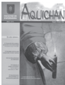
AQUICHAN 3 Año 3, No. 3, octubre 2003