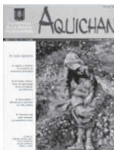
AQUICHAN 7 Año 7 Vol. 7 No. 2, 113-236 Octubre 2007