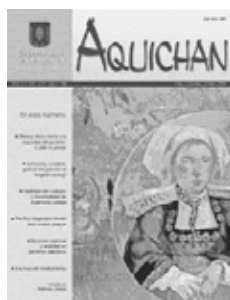
AQUICHAN 6 Año 6 Vol. 6 No. 1, octubre 2006