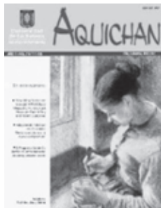
AQUICHAN 7 Año 7 Vol. 7 No. 1, 1-112 Abril 2007