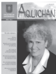
AQUICHAN 2 Año 2, No. 2, octubre de 2002