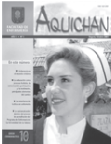
AQUICHAN 1 Año 1, No. 1, octubre de 2001