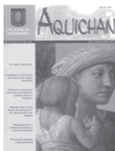
AQUICHAN 5 Año 5, No. 1, octubre 2005