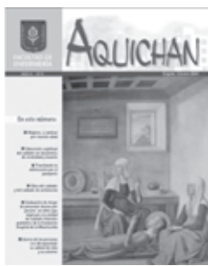
AQUICHAN 4 Año 4, No. 4, octubre 2004