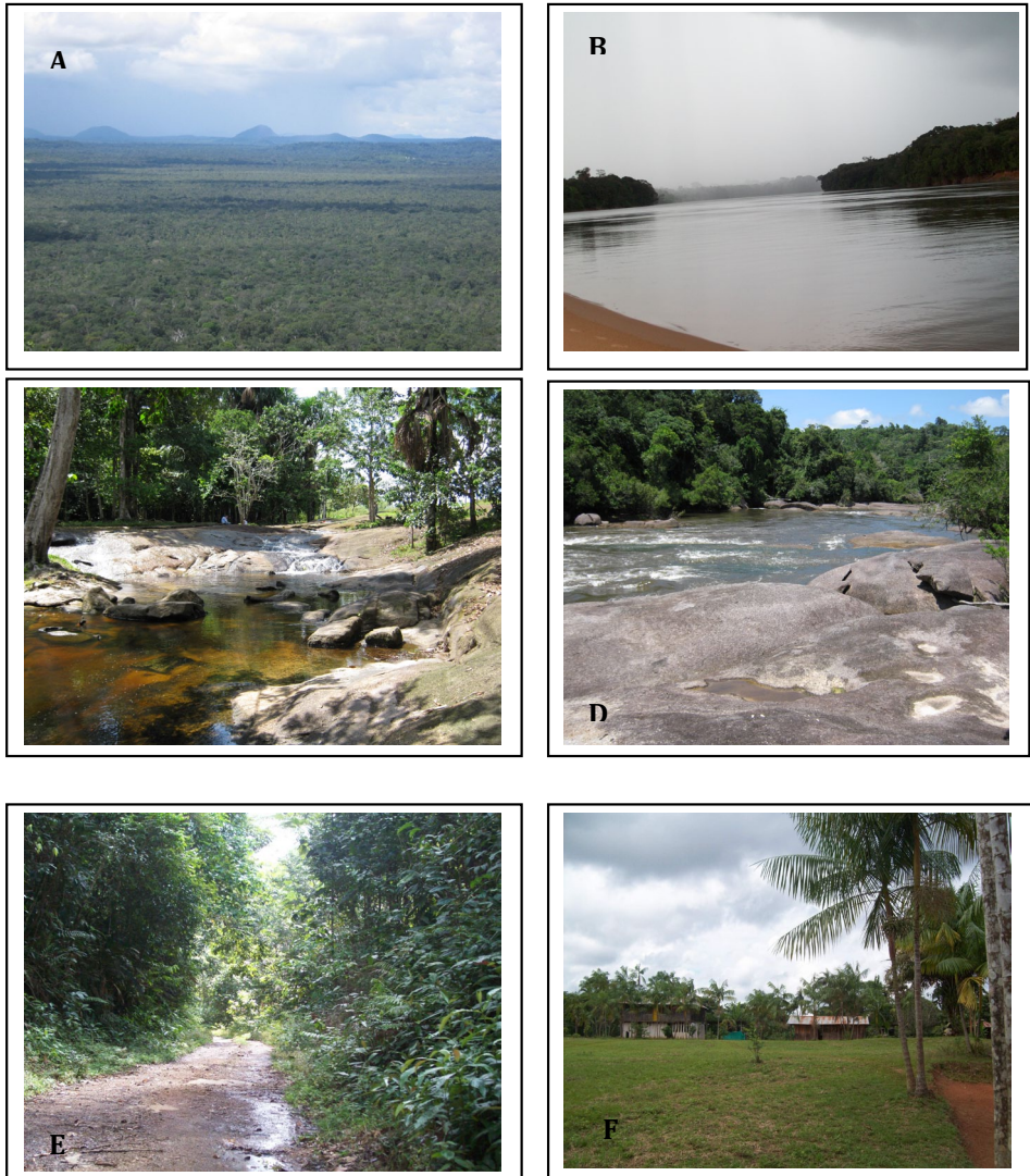
Figura 3. Vegetación característica de la zona de estudio, a) panorámica de la selva amazónica desde Cerro Venado. b) Río Vaupés. c) Caño Ceima. D). Río Vaupés en Tayasú. E) Vía a Santa Cruz. F) Aspecto general de las comunidades en el Vaupés.