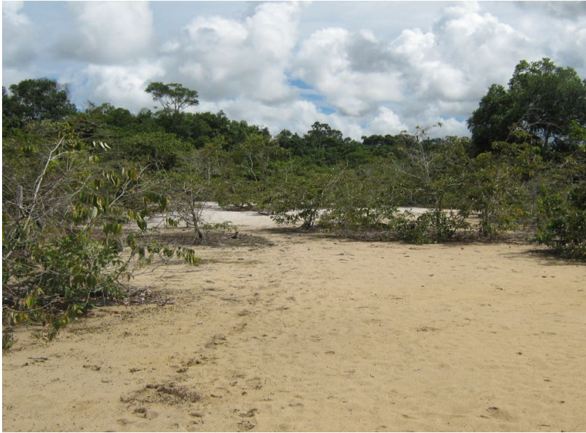
Figura 4. Vegetación característica de los suelos ácidos y ferruginosos, camino Puerto Arrendado, Agua Blanca.