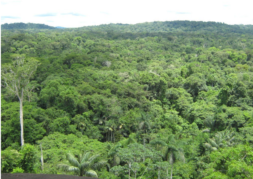
Figura 2. Panorámica de la selva húmeda cerca a Mitú

(2004), libros y artículos publicados en Colombia y en países vecinos como VÉLEZ & CONSTANTINO 1989, VÉLEZ & SALAZAR 1991, CONSTANTINO 1995, CONSTANTINO & SALAZAR 2010a, LECROM et al. 2002, LECROM et al. 2004, SALAZAR et al. 1998, SALAZAR et al. 2010, RODRÍGUEZ et al. 2010, CONSTANTINO & HURTADO 2010, KARIYA 2006, con el complemento adicional de los tipos encontrados digitalmente en www.neotropicalbutterflies.com , entre otros. El material colectado se encuentra depositado en la colección de Gabriel Rodríguez (CGR) en Mitú - Vaupés.