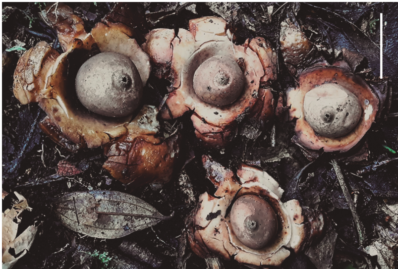
Figura 1. Registro fotográfico macroscópico de los basidiomas de Geastrum triplex . Basidiomas maduros en vista apical con detalle del exoperidio y endoperidio. Se observa en todos los cuerpos fructíferos el disco exoperidial pseudoparenquimatoso. Escala 4,0 cm.

Basidiosporas: 3,9-4,5 x 4,1-4,5 \mu\text{m} [ x = 4,4 \pm 0,5 \times 4,1 \pm 0,5 \mu\text{m} , Q_m = 1,1 ; n=77 ], globosas, verrugosas romas, color marrón a amarillo en KOH (Figura 3).