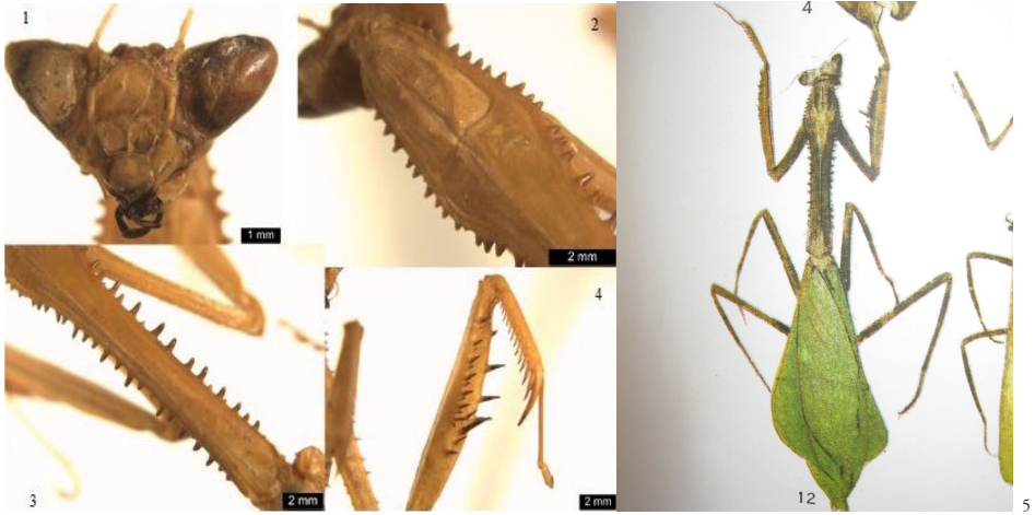
Figuras 1-5. C. dubiosa G-T., ♂ Cabeza (1), Pronoto dorsal (prozona) (2), Pronoto dorsal (metazona) (3), Pata anterior izquierda (4). Ejemplar hembra de C. dubiosa G-T. de Apolinar (1937) (5), Ejemplar ♂ depositado en la Universidad de los Llanos.