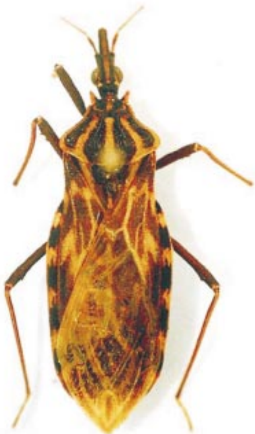
Figura 2. Triatoma nigromaculata (Stål, 1859), ejemplar encontrado en la vereda La Playa del municipio de El Tambo en Cauca, Colombia.

de P. rufotuberculatus , E. cuspidatus , E. mucronatus , R. pictipes , R. robustus , R. dalessandroi , R. neivai y R. brethesi .