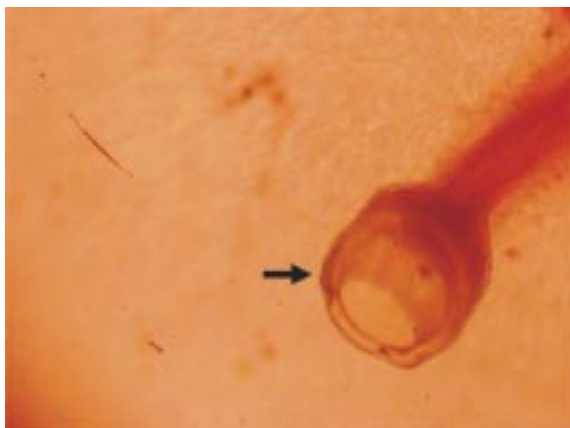
Figura 2. En la microfotografía de mayor aumento se observa la cápsula bucal en forma de copa del ejemplar macho de Mammomonogamus laryngeus .