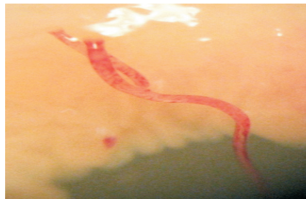
Figura 3. Mammomonogamus laryngeus en el repliegue ariteno-epiglótico de uno de los bovinos de la central de beneficio del municipio de La Tebaida, Quindío; nótese su característica forma en Y. Estereoscopio.