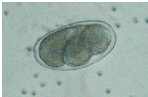
Figura 2. Huevos de Mammomonogamus laryngeus con un tamaño de 45 x 80 \mu\text{m} . Se puede apreciar la ausencia de opérculo. Microscopio invertido Olympus CK2®, 40X.

cuales, aproximadamente, la mitad se originó en la isla de Martinica (9). En Norteamérica se han reportado cinco casos, y en todos las personas refirieron haber visitado la zona del Caribe (4,10,11). La singamosis humana se ha reportado en las islas del Caribe y en Suramérica, especialmente en Brasil; otros reportes provienen de Australia (6), Canadá (8), Estados Unidos (4,8,12), Reino Unido (13,14) y Francia (15,16). En el continente asiático también existen casos reportados en Filipinas, Corea y Tailandia, aunque se piensa que en algunos de ellos las infestaciones habían sido adquiridas en China, Vietnam y Malasia (3).