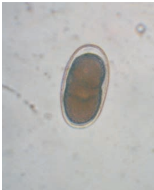
Figura 1. Huevo de Ancylostoma spp. Microscopio invertido Olympus CK2™, 400X.

taban diarrea, se halló una razón de probabilidad de 4,2 (p<0,05), por lo que la probabilidad de encontrar que un gato con diarrea haya eliminado parásitos adultos es cuatro veces más alta comparada con la de un gato sin diarrea.