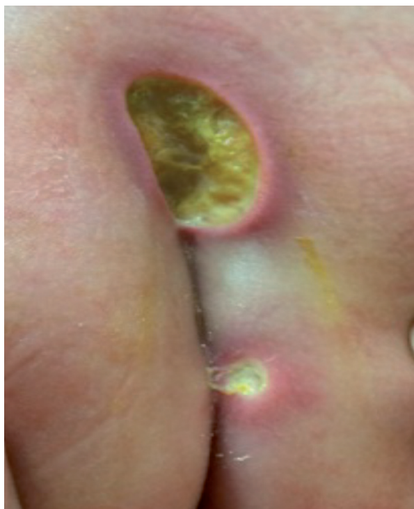
Figura 5. Lesiones múltiples que evolucionaron a úlceras en la zona perianal en el paciente 5.

En el presente estudio, se presentaron 12 casos de lesiones que evolucionaron a úlceras, de los cuales se confirmaron 11 como fiebre de chikunguña