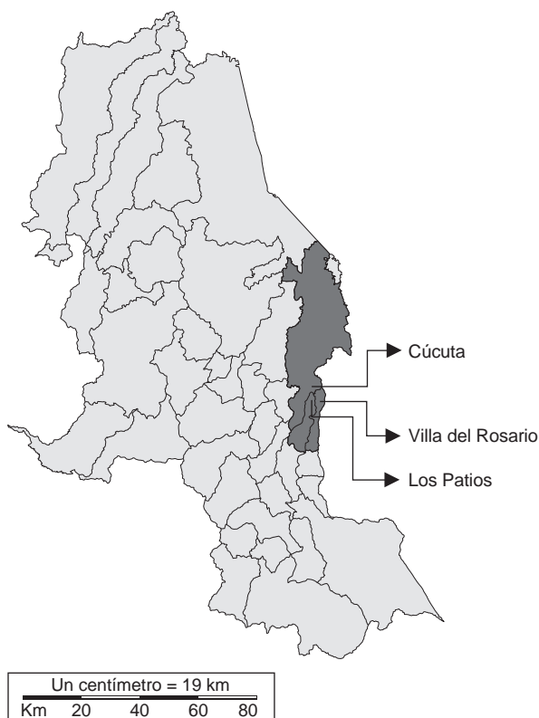
Figura 1. Ubicación de los municipios de Cúcuta, Villa del Rosario y Los Patios, Norte de Santander, Colombia

La cobertura del servicio de acueducto en Villa del Rosario es de 74,6 % y, en Los Patios, de 75 %; en ambos municipios la calidad del agua es deficiente y su distribución es intermitente, pues se distribuye cada ocho a 15 días en algunos sectores (19-20). En Cúcuta, el servicio de acueducto en algunos sectores también es intermitente y el suministro se hace en tanques o cisternas. Estos problemas de abastecimiento de agua en los tres municipios obligan a la población a almacenarla en tanques, canecas y baldes, situación que propicia la reproducción del vector del chikungunya y del dengue en la región.