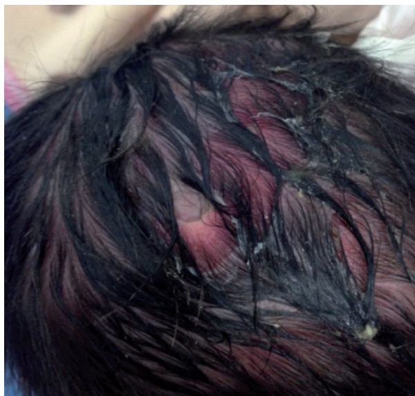
Figura 3. Lesión ulcerosa en cuero cabelludo con bordes bien definidos en el paciente 2.