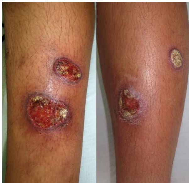
Figura 1. Úlceras de borde grueso y fondo granuloso, algunas hiperqueratósicas, en las piernas

En la revisión de la biopsia se encontró piel ulcerada con hiperplasia pseudocarcinomatosa e inflamación dérmica difusa granulomatosa, con macrófagos vacuolados y abundantes plasmocitos, así como