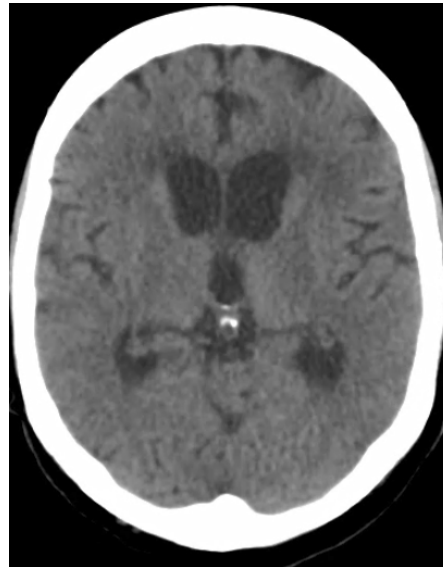
Figura 1. Tomografía de cráneo que muestra aumento de tamaño de los ventrículos laterales y el tercer ventrículo, indicativo de hidrocefalia no comunicante

Tenía antecedentes de hipertensión arterial, hipotiroidismo y artritis reumatoide que venía siendo tratada con 5 mg de prednisolona al día y 5 mg de tofacitinib cada 12 horas desde hacía tres años. No había informado de efectos adversos asociados con el medicamento.