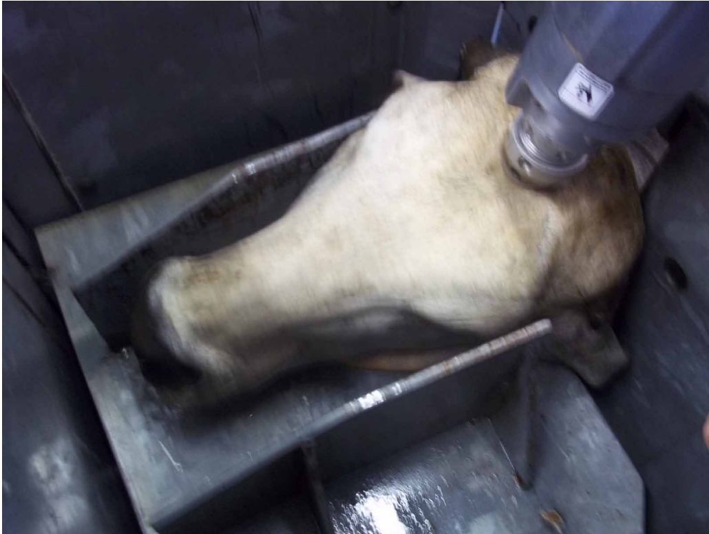
Figura 4. Cajón de aturdimiento que garantiza la sujeción de los animales. Obsérvese la aplicación de la pistola en el lugar correcto, para garantizar la eficiencia de la insensibilización.

además del entrenamiento y la capacitación de los manejadores de ganado, la disminución del uso de tábanos eléctricos, mejoras en el diseño de las plantas de acuerdo con lineamientos de comportamiento y la eficiencia de la insensibilización, entre otros aspectos (11, 45, 48).