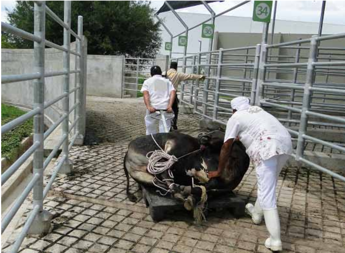
Figura 2. Las plantas deben contar con un protocolo para el manejo de bovinos fracturados o con incapacidad para moverse, además de un programa para el sacrificio de emergencia.

Por otra parte, las plantas deben contar con un protocolo para el manejo de bovinos fracturados o con incapacidad para moverse, además de un programa para el sacrificio de emergencia. En especial, es fundamental que se cuente con plataformas o vehículos apropiados para movilizar los bovinos bajo estas circunstancias (figura 2). Los lineamientos para llevar a cabo eficientemente esta etapa se presenta en la tabla 3.