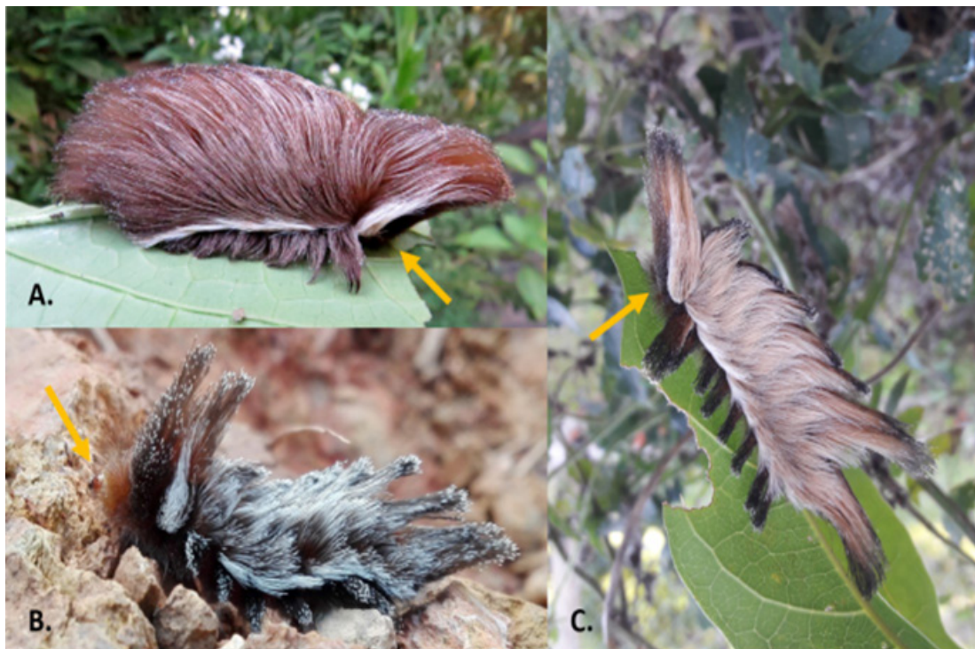
Figura 1. Larvas de Podalia orsilochus en diferentes países americanos. La flecha señala la cabeza. (Fotografías publicadas con permiso de los respectivos autores- en paréntesis). A, Xerém, Duque de Caxias, Rio de Janeiro, Brasil; B, Pajarito, Boyacá, Colombia; C, Candelaria, Misiones, Argentina. Especímenes identificados por Milena Casafús.

La distribución de P. orsilochus incluye países americanos como México, Costa Rica, Panamá, Ecuador, Venezuela, Guyana, Brasil y Argentina (Janzen & Hallwachs, https://bit.ly/3arwNbj ; Lepesqueur, 2012; Sánchez et al. , 2019; iNaturalist).