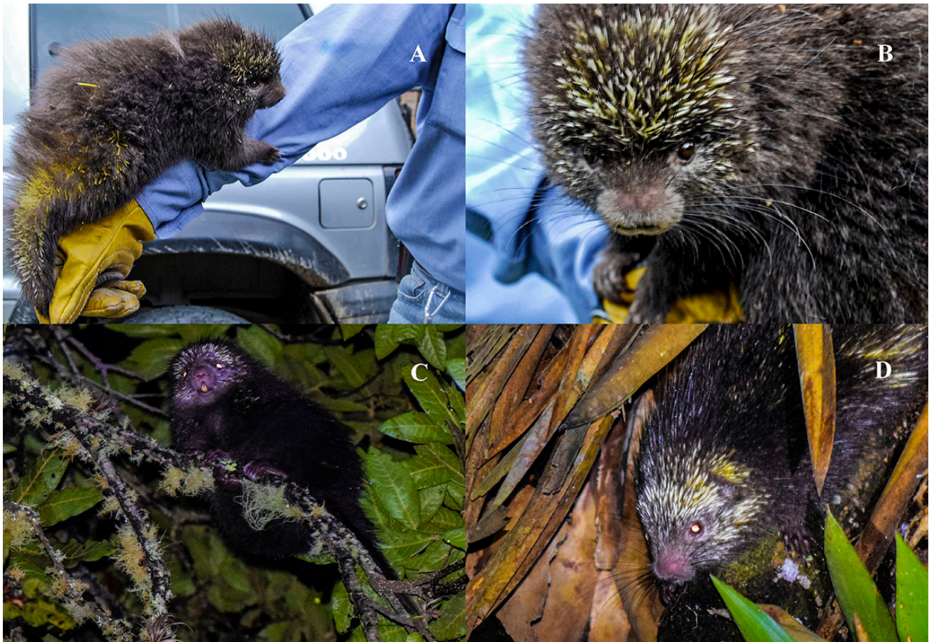
Figura 1. Registros recientes de Coendou vestitus en Boyacá, Colombia. A-B, individuo de Villa de Leyva (2015); C-D, individuo de Gachantivá (2018). Nótese el tamaño corporal pequeño, la cola corta, el pelaje dorsal largo de color negruzco que oculta las espinas de manera parcial, y las cerdas bicolors.

Figure 1. Recent records of Coendou vestitus in Boyacá, Colombia. A-B, individual from Villa de Leyva (2015); C-D, individual from Gachantivá (2018). Note the small body size, short tail, long blackish dorsal fur concealing the quills, and bicolored bristle-quills.