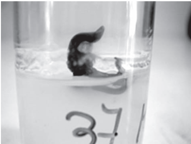
Figura 2. Plántula anormal en medio de cultivo.

donde prospera Schinus fasciculata , los frutos presentaron mayor contaminación por patógenos fúngicos en años de elevadas precipitaciones entre la floración y la plena madurez. Esto dio como resultado una menor germinación (Alzugaray et al., 2007). Sansberro et al. (2003), trabajando en Schinopsis balansae , registraron un porcentaje de explantos contaminados del 30%, siendo el tiempo de exposición en hipoclorito de sodio de 10 min, en lugar de 20 min utilizado en este trabajo. Contaminaciones del 20-30% de los explantos fueron presentados por Rodríguez et al. (2011) en Gleditsia amorphoides utilizando 20 min de inmersión en hipoclorito de sodio. Otros autores completan la desinfección con otros desinfectantes como cloruro de mercurio o fungicidas que pueden afectar los cultivos, es el caso de Benmahiou et al. (2009) en Pistacia vera y de Rosero (2004) en Tectona grandis que agregan Cobox a la desinfección.