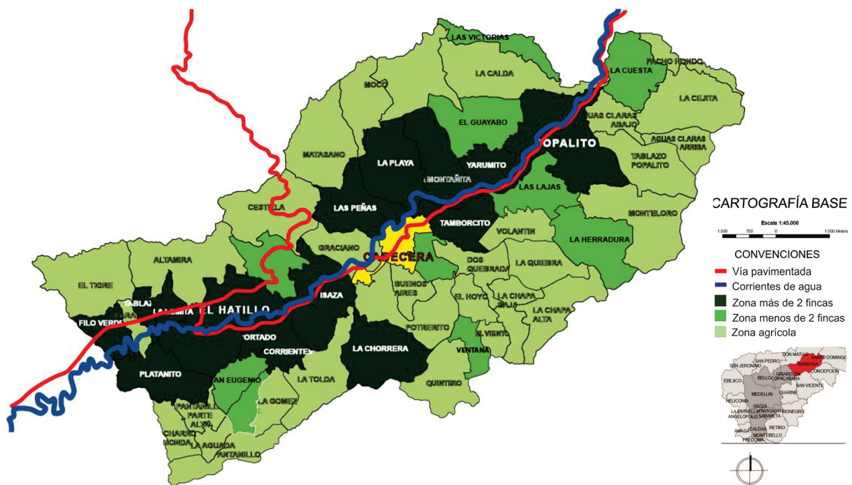
Figura 2. Ubicación de las fincas de recreo y de las principales veredas con producción agrícola