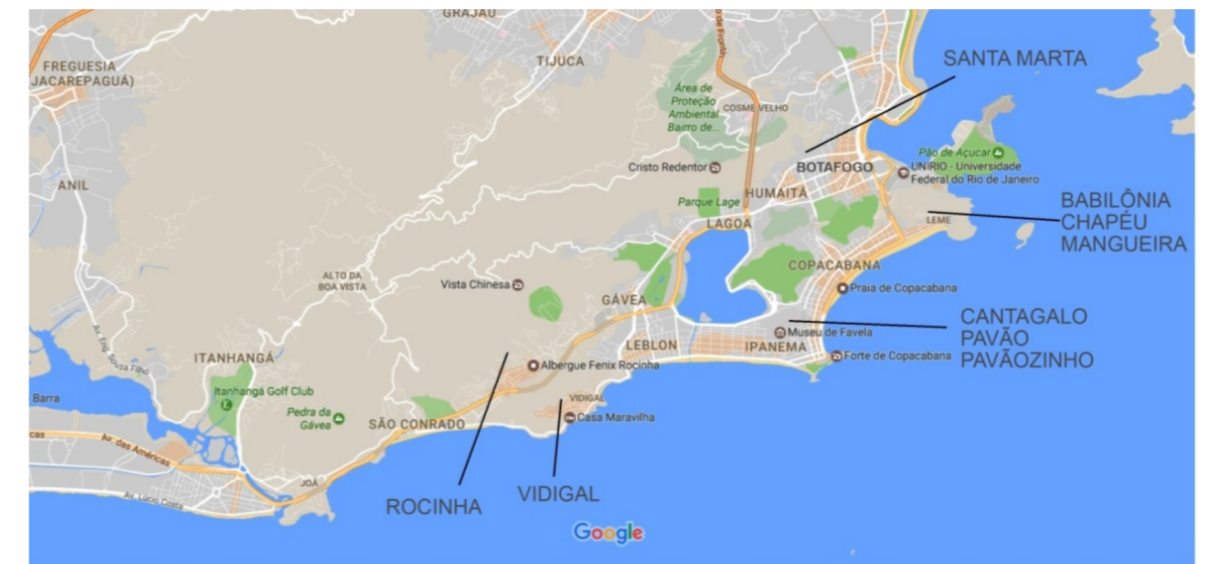
Fonte: desenho do autor sobre Google Maps, 2017.