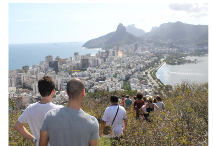
Figura 1. Vista do bairro de Ipanema a partir do Cantagalo-Pavão-Pavãozinho

Por outro lado, as ideias do turismo de base comunitária levantadas por Bartholo, Sansolo e Bursztyl (2009), mostram possibilidades de o turismo trazer benefícios para os moradores locais, como também tratam autores como Beeton (2006) e Steinbrink, Frenzel e Koens (2012) ao falar das possibilidades do turismo para o empoderamento, de renda e melhorias para as comunidades, ao ser realizado de maneira consciente e ética. Nesse contexto temos os relatos sobre a participação comunitária nos livros de Rodrigues (2014), e Pinto, Silva e Loureiro (2012), produtos de participantes desses processos nas comunidades aqui estudadas, de Santa Marta e Cantagalo-Pavão-Pavãozinho. O estudo de albergues e mobilidade nas favelas tem sido apresentado por Fagerlande (2016, 2017b) que mostra como se dá a relação entre mobilidade, visitação e hospedagem nas favelas turísticas.