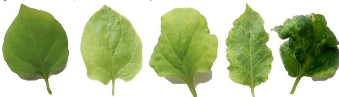
Figura 1. Escala de síntomas para la virosis del CMV en hojas de N. benthamiana .

A. Grado 0= Hoja aparentemente sana. B. Grado 1= Hoja con mosaico leve, sin arrugamiento. C. Grado 2= Hoja con mosaico leve o deformación. D. Grado 3= Hoja con deformación y/o mosaicos moderados. E. Grado 4= Hoja con mosaico y/o deformación severa.