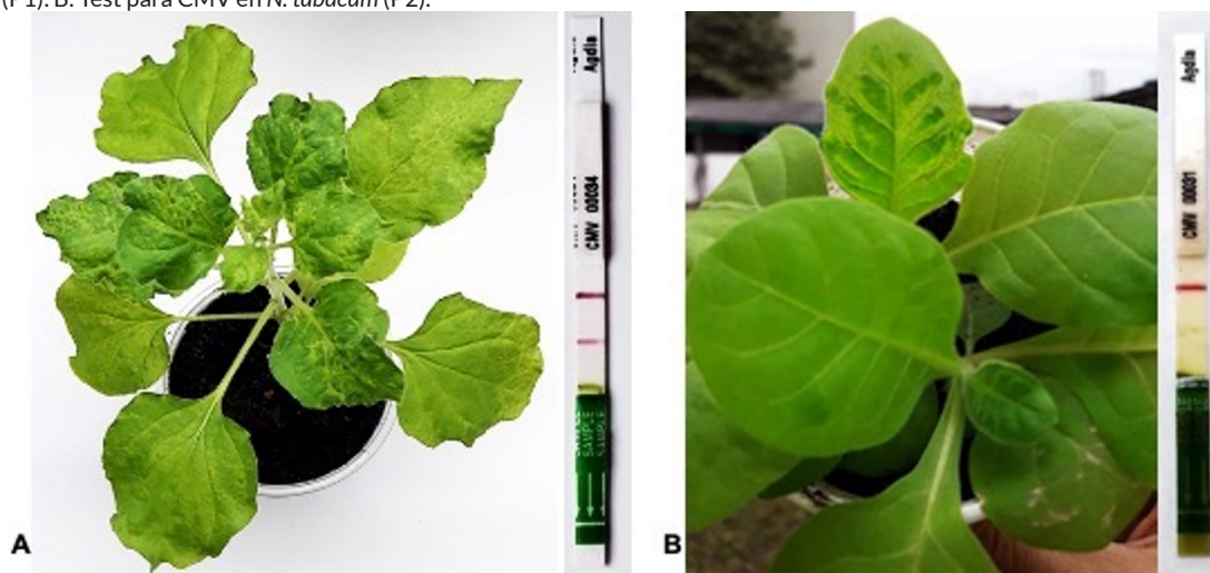
Figura 3. Test de ImmunoStrip® para la detección del CMV en plantas indicadoras. A. Test para CMV en N. benthamiana (P1). B. Test para CMV en N. tabacum (P2).

Un estudio realizado por Alhares y Al-Fadhel [28] en plantas indicadoras permitió identificar la presencia del CMV a través del empleo de ImmunoStrip®. Kwon et al. [29] también usaron esta técnica para comprobar que el CMV era el agente causal de manchas cloróticas y de malformación en plantas indicadoras. Del mismo modo, Chikh-Ali et al. [30] confirmaron mediante inmuno-tiras, la presencia de PVY, en la que el extracto de hojas de papa maceradas reaccionó con los anticuerpos específicos para este virus, mientras que en otras investigaciones se ha obtenido buena sensibilidad con el uso de inmuno-tiras [31, 32, 33].