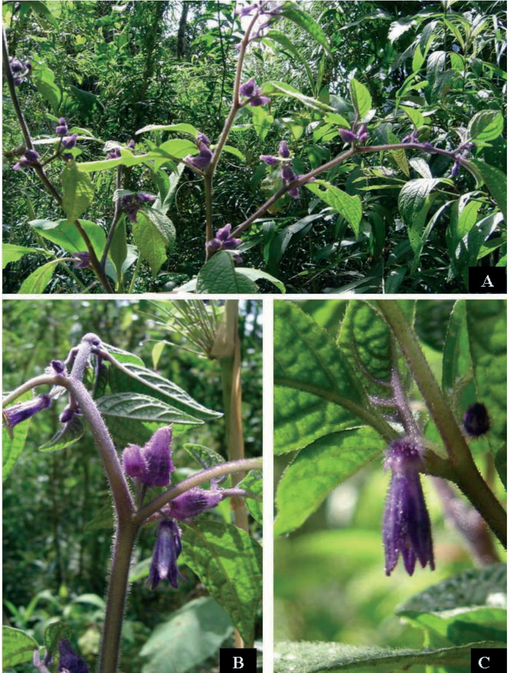
Figura 2. Deprea cyanocarpa J. Garzón & C. I. Orozco. A. Hábito. B. Rama con flores y frutos. C. Detalle de flor.