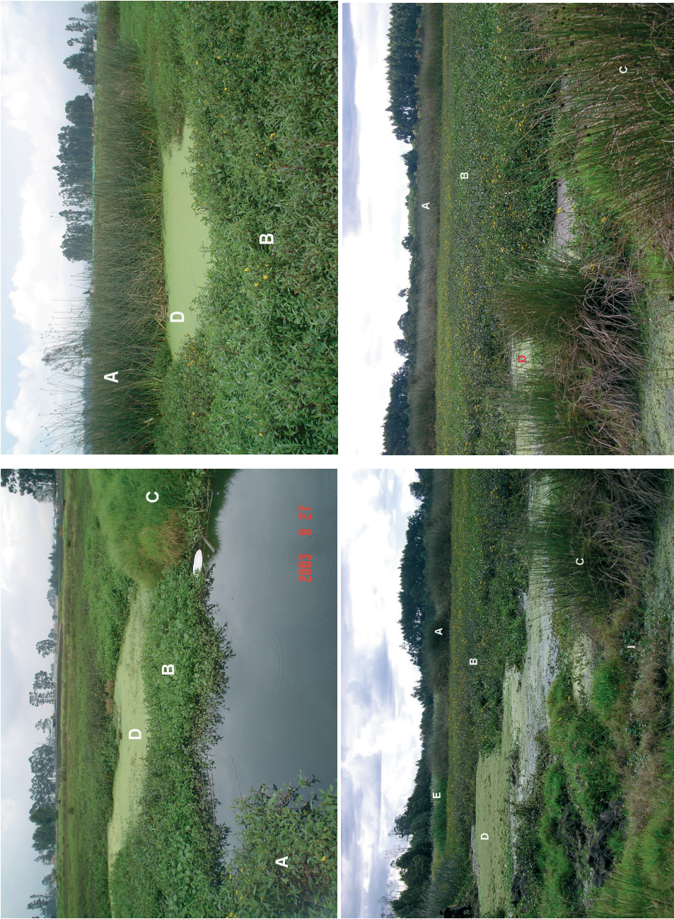
A: Junca de Schoenoplectus californicus B: Camalotal de Bidens laevis C: Junca de Juncus effusus D: Vegetación flotante con especies de Lemna E: Totoral de Typha latifolia I: Vegetación enraizada con Hydrocotyle ranunculoides Figura 4. Variedad de hábitat y comunidades vegetales en Jaboque.