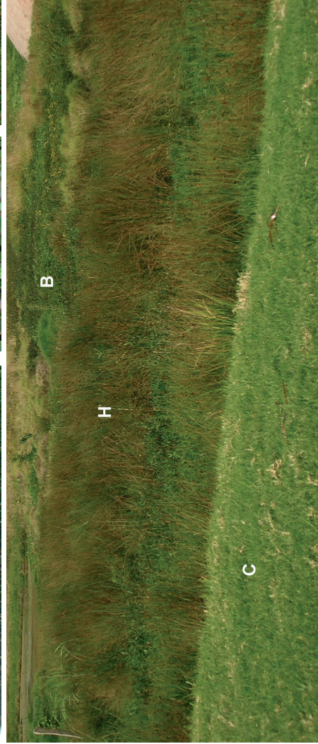
Figura 3. Diferentes comunidades vegetales en el humedal de Jaboque (Bogotá, Colombia).