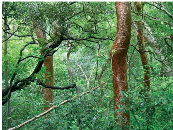
Figura 4. Interior del bosque en el sitio “Camino a Cinto”. En primer plano, a la derecha de la fotografía, un tallo de Bursera simaruba ; a la izquierda, de color oscuro e inclinado, el de Capparis odoratissima.