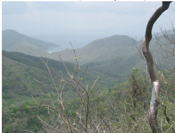
Figura 3. Vegetación de la zona sur de la ensenada de Neguanje. En primer plano un fuste de “resbalamono”, Bursera simaruba . Al fondo la orilla occidental de la ensenada.