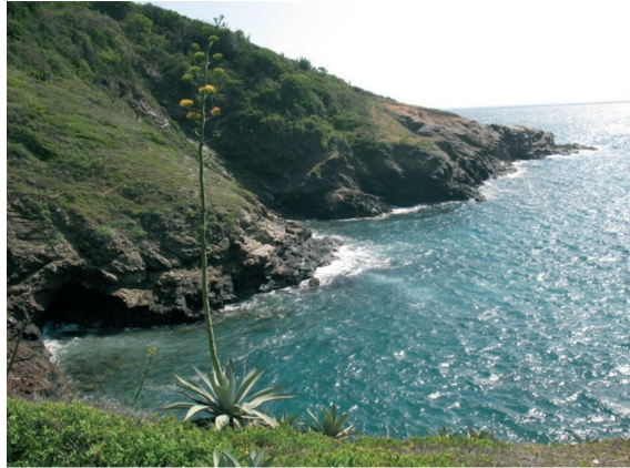
Figura 2. Orilla occidental de la ensenada de Neguanje, cerca de playa “Placelito”. En primer plano la especie Agave cocui , en floración.