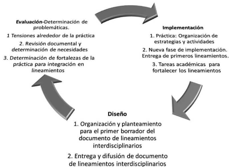
Figura. 1. Fases de la investigación.

Para la etapa de análisis de datos, el procedimiento se fundamentó en lo siguiente: