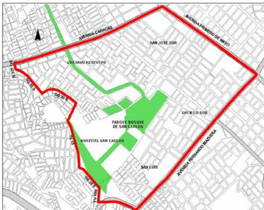
Mapa 1. Unidad de planeamiento zonal San José