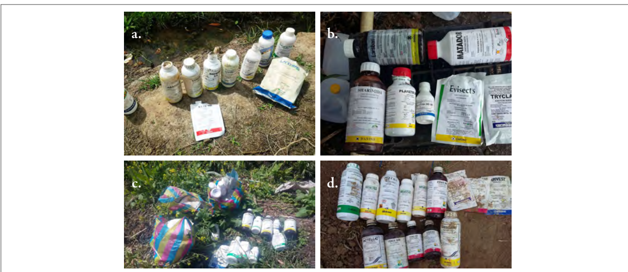
Figura 3. Envases de plaguicidas dispersos en campos de cultivos de Ecuador. a. Arenillas, provincia del Oro; b. Pedro Carbo, provincia del Guayas; c. Pallatanga, provincia de Chimborazo; d. El Morro, provincia de Santa Elena.

mente mujeres y niños. Estudios realizados en Ecuador detectaron la presencia de residuos de plaguicidas clorados en los productos finales de los cultivos de papa, pimiento y tomate, pero con cantidades que no superaron los límites máximos permitidos (Ministerio de Ambiente, 2004). Otras investigaciones efectuadas sobre la canasta básica familiar en muestras de tomate recolectadas en cuatro provincias del país determinaron que los residuos del plaguicida metamidofos se encontraban ocho veces sobre el Límite Máximo de Residuos (LMR) (Crissman et al., 2002).