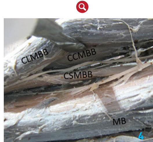
Fotos 3 y 4. Caso 2. Vista anterior del brazo izquierdo

CLMBB: Cabeza larga del músculo Biceps Brachii; CSMBB: cabeza supernumeraria del músculo Biceps Brachii; CCMBB: Cabeza corta del músculo Biceps Brachii; MB: Músculo Brachialis; MD: Músculo Deltoideus; TCMBB: Tendón común del músculo Biceps Brachii; NMC: Nervio musculocutáneo.