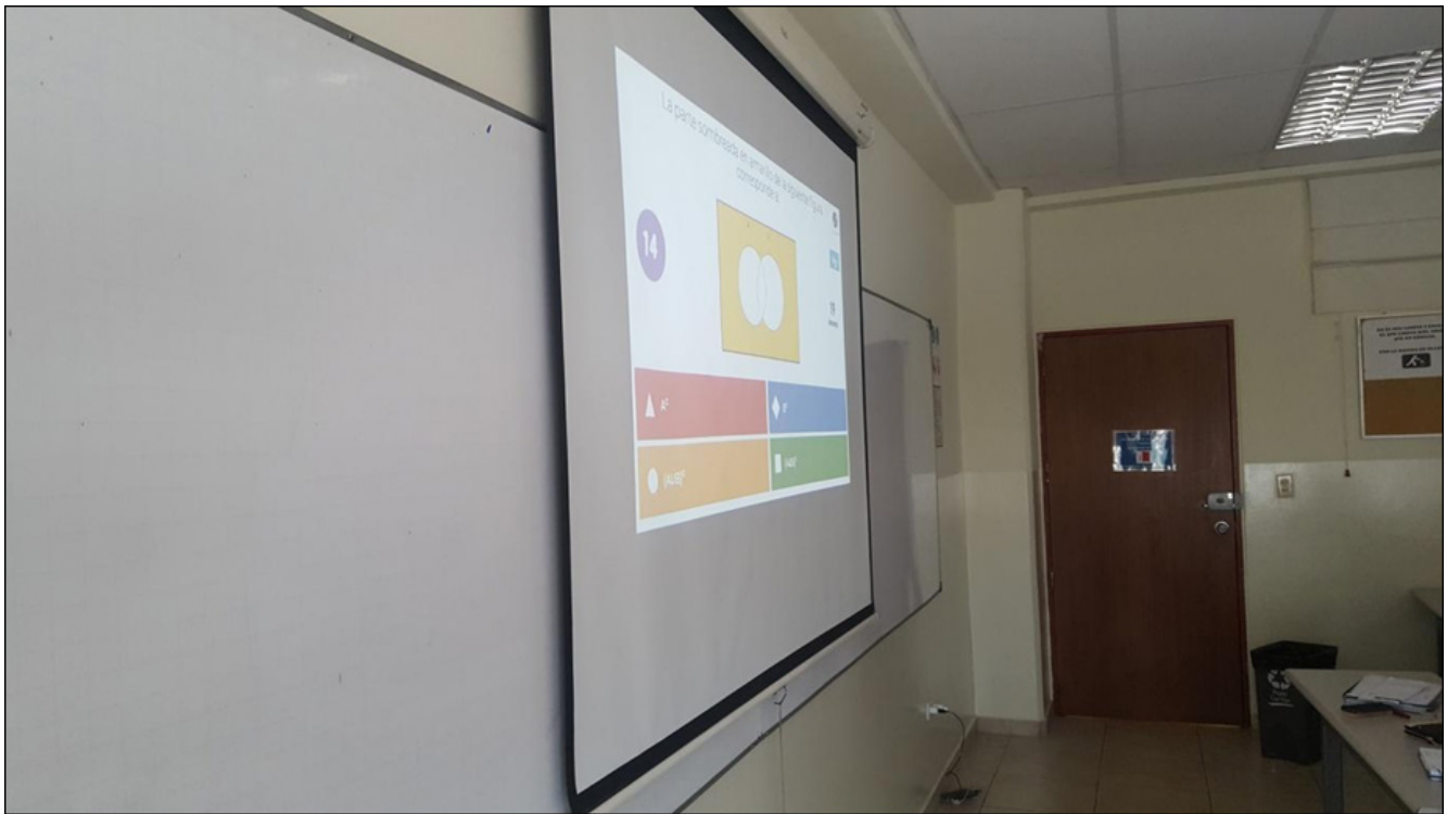
Figura 4. Perspectiva diagonal de la proyección de una de las preguntas en Kahoot, a los estudiantes del curso de Matemática Discreta.