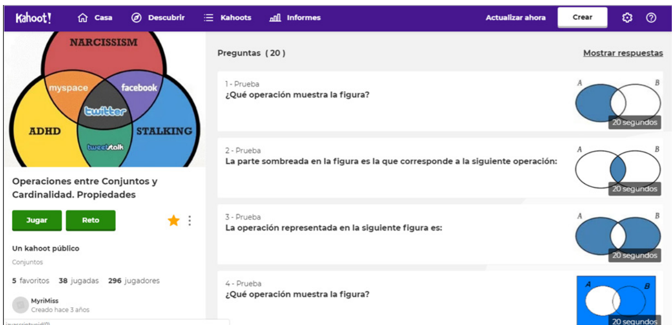
Figura 1. Interfaz de la cuenta Kahoot del docente.

Una vez realizado el juego se descargaron los resultados, los cuales se pueden ver y editar en formato Excel obteniéndose información general (figura 5) y detallada (figura 6) de las respuestas seleccionadas por los estudiantes en cada pregunta realizada.