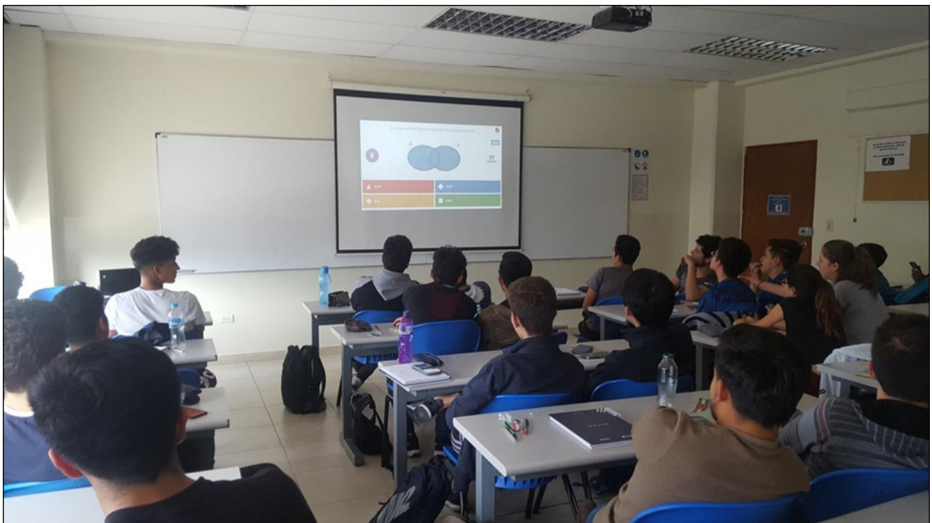
Figura 3. Desarrollo de la actividad por parte de los estudiantes del curso de Matemática Discreta, en el aula, haciendo uso de Kahoot, proyector y pizarra.