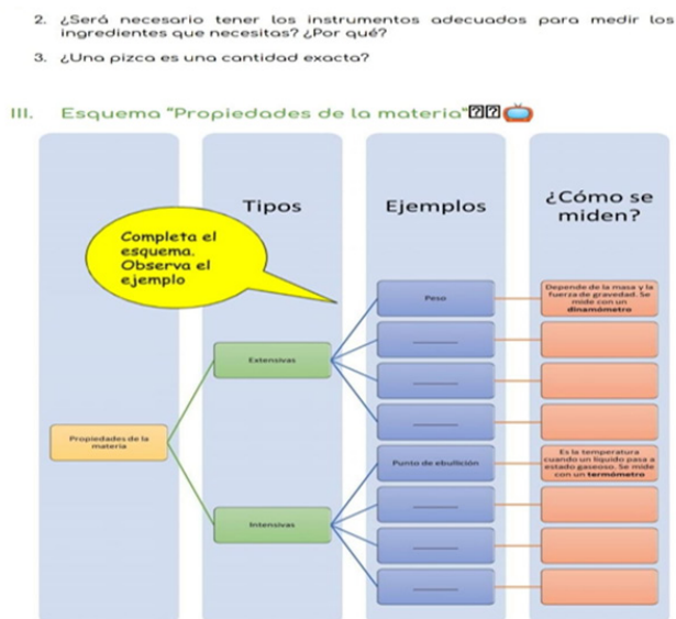
Figura 3. Extracto de la planificación del docente, caso 1.