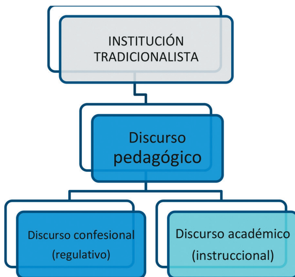
Ilustración 2. El discurso pedagógico en la institución Tradicionalista

área específica, resulta dominado por lo regulativo del pensar católico en las condiciones sociales para su reproducción y termina configurando una institución tradicionalista, es decir, basada en la tradición y el pensamiento mítico. Entonces, se tiene el siguiente esquema: